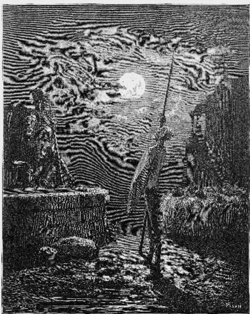
Рис. 1.2. Дон Кихот охраняет ночью свои доспехи во дворе постоянного двора, дабы заслужить посвящение в рыцари. Красивая картинка Гюстава Доре. Взято из [765:2], с. 1, вклейка между с. 64–65.