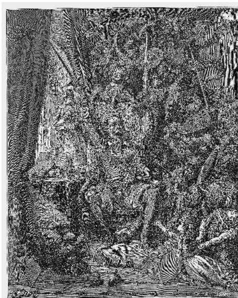
Рис. 1.1. Дон Кихот погрузился в мир фантазий. Иллюстрация-картинка Гюстава Доре. В общем-то, нарисовано для детей. Взято из [765:2], с. 1, вклейка между с. 32–33.