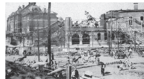
РАЗРУШИТЕЛЬНОЕ ЗЕМЛЕТРЯСЕНИЕ 1923 ГОДА

В 1923 году землетрясение разрушило Токио и пригородные зоны (более 150 000 жертв), страна посвятила себя восстановлению охваченной хаосом столицы. Пока экономическая ситуация ухудшалась, Императорская армия все настой-