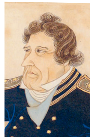
ПРИБЫТИЕ ЧЕРНЫХ КОРАБЛЕЙ