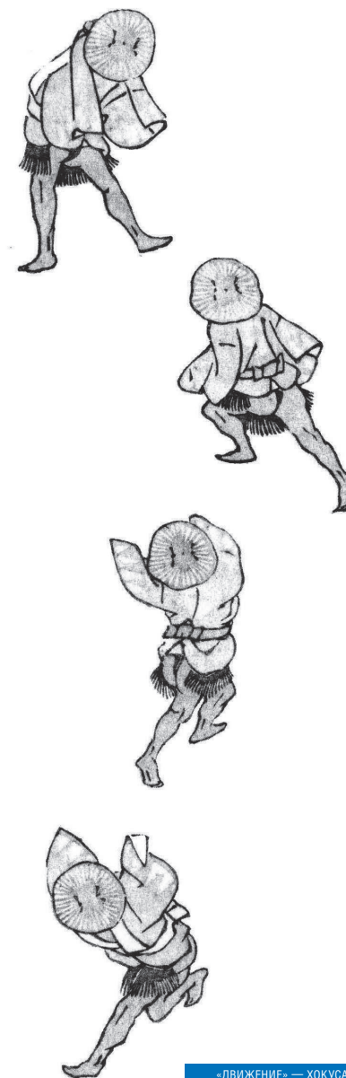
«ДВИЖЕНИЕ» — ХОКУСАЙ