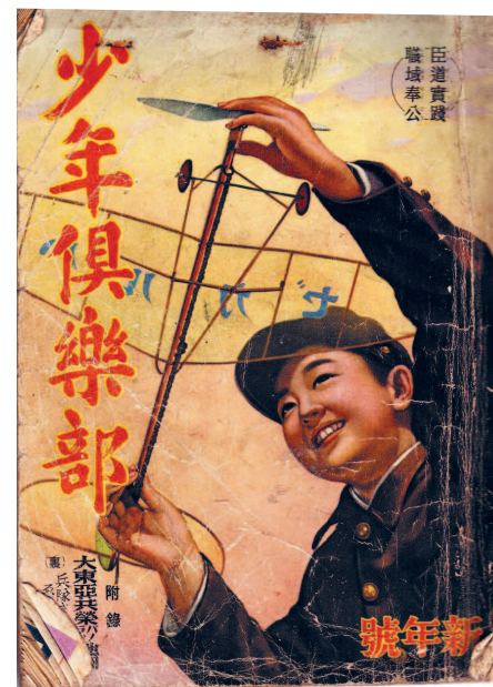
SHŌNEN CLUB (ЯНВАРЬ 1941)