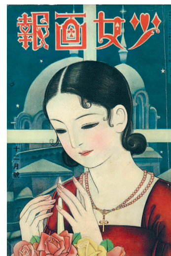
ДЕВИЧЬИ ИЛЛЮСТРАЦИИ (МАЙ 1933)