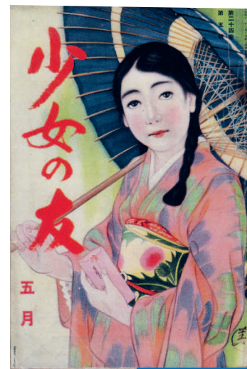
ПОДРУЖКА (МАЙ 1931)