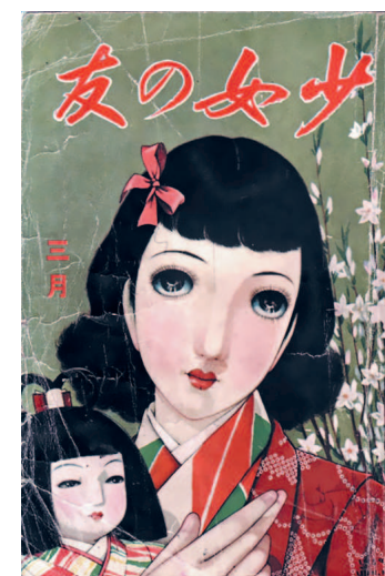
ПОДРУЖКА (МАЙ 1939)