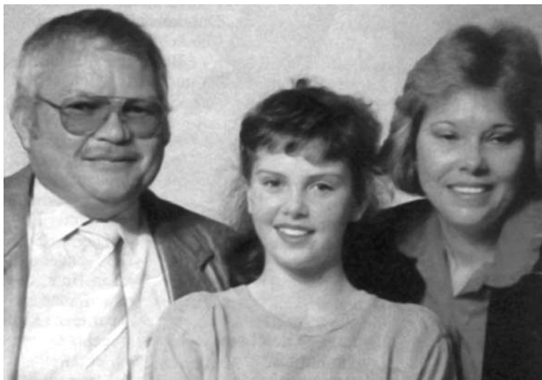
Шарлиз Терон с родителями. 1980-е гг. «Я выросла в ЮАР, сейчас смотрю на карту и понимаю, что была на краю мира...» (Шарлиз Терон)