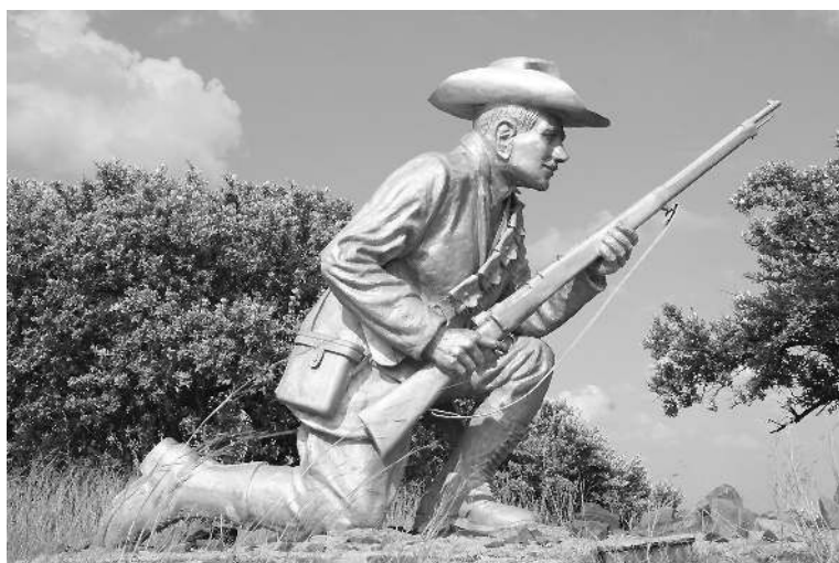
Статуя Терона в форте Шанскоп. Даниэль Йоханнес Стефанус (Дани) Терон (1872–1900) – бурский офицер-разведчик, герой Второй англо-бурской войны. Двоюродный прадед актрисы Шарлиз Терон