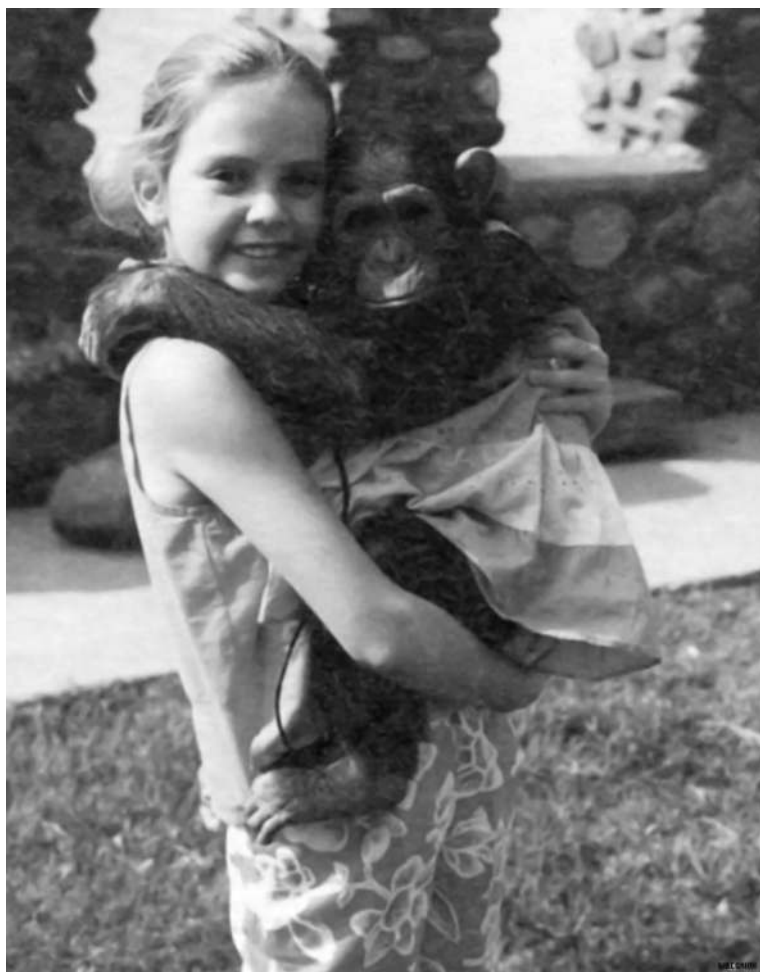
Будущая актриса со своей обезьянкой. Йоханнесбург. 1980-е гг.