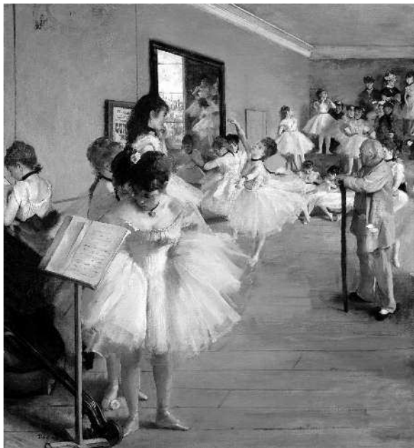
Эдгар Дега. Класс танца. 1874 г. Музей искусств Метрополитен. Нью-Йорк

который не стремился к реализму и повторению уже существующего. Художник Эдгар Дега в основном не работал с натурой, но при этом увлекался фотографией. Его работа «Голубые танцовщицы» 1897 года написана по мотивам его же фотографии, запечатлевшей танцующую девушку. Таким образом он писал многие работы, а также использовал их для изучения движения. Третье — возможность путешествовать. Так художники открыли для себя Японию и Африку, а также национальное искусство этих стран и континентов, которое имело сильное влияние на их творчество.