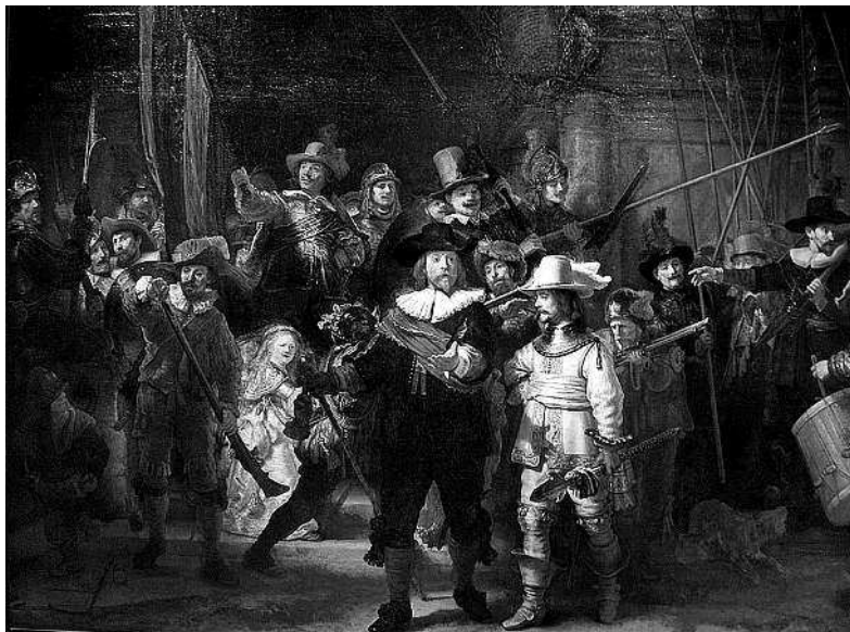
Рембрандт Харменс ван Рейн. Ночной дозор. 1642 г. Рейксмузеум. Амстердам

и более узкое определение, но суть остается прежней — современные художники используют актуальные изобразительные материалы и поднимают важные для своего времени темы, и они сильно отличаются от той палитры проблем, которую могли использовать классические мастера. Сейчас художники имеют большую свободу, и их работа не ограничивается использованием красок, холста, глины или бронзы. Они могут создавать инсталляции, сложные объекты, снимать видеоарт, экспериментировать со звуком или участвовать в перформансах, чем-то напоминающих театрализованные действия. И эти формы приходят на смену обычным картинам в золоченых рамах, мраморным скульптурам.