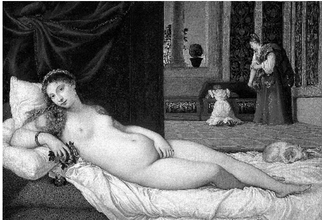
Тициан. Венера Урбинская. 1538 г. Галерея Уффици. Флоренция

Или как вам тот факт, что Эрмитаж был задуман как музей современного искусства. Во время его создания в коллекцию отбирали актуальные на тот момент работы голландских художников, а сейчас мы воспринимаем этот музей исключительно как классический, и все попытки добавить к привычной экспозиции современных художников большинством воспринимаются в штыки. Так, выставка «Ян Фабр: рыцарь отчаяния — воин красоты» 2016 года создала вокруг себя много шума. В своих работах художник помимо прочего использовал чучела животных, правда, он находил сбитых зверей, а не убивал их, и этим пытался привлечь внимание к проблеме брошенных домашних животных. Но об этом многие зрители даже не потрудились узнать, и вместо того, чтобы лучше разобраться в творчестве художника, начали писать петиции и устраивать скандалы. Но сейчас не об этом, а о важных выводах, которые можно сделать при сравнении современного и классического. Создавая упомянутую выше выставку, кураторы Эрмитажа задействовали множество интересных задумок, которые должны были повлиять на восприятие зрителей. К примеру, разместили рядом с работами мастера фламандского барокко XVII-XVIII веков Франса Снейдерса, который писал масштабные и на современный вкус несколько мрачноватые