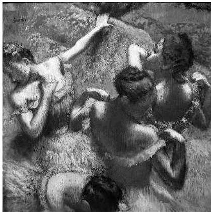
Эдгар Дега. Голубые танцовщицы. 1897 г. Государственный музей изобразительных искусств имени А.С. Пушкина. Москва

Нам, возможно, хотелось бы думать иначе, но смотреть искусство в музее — это не развлечение вроде похода в кино на голливудский блокбастер. Искусство не должно быть эстетически красивым, оно не должно быть понятным, не должно восхищать, радовать или быть доступным и легким. Оно вообще никому и ничего не должно, и это тоже важно помнить. Основная цель искусства — это рефлексия. Она дает человеку возможность задуматься, а может даже попытаться понять то, что происходит с ним лично и с обществом, нашим миром в целом. Правда, думать любят немногие. Мы не делим сейчас всех людей на категории, а просто обозначаем всем хо-