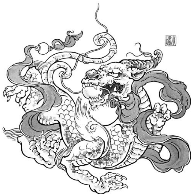
Пяо – крылатый лев-единорог

иньская «Книга перемен» («И-цзин»), а также «Каталог гор и морей», «Исторические записки» Сыма Цяня, стихи поэта Цюй Юаня (III в. до н. э.), «Записки о поисках духов» Гань Бао.