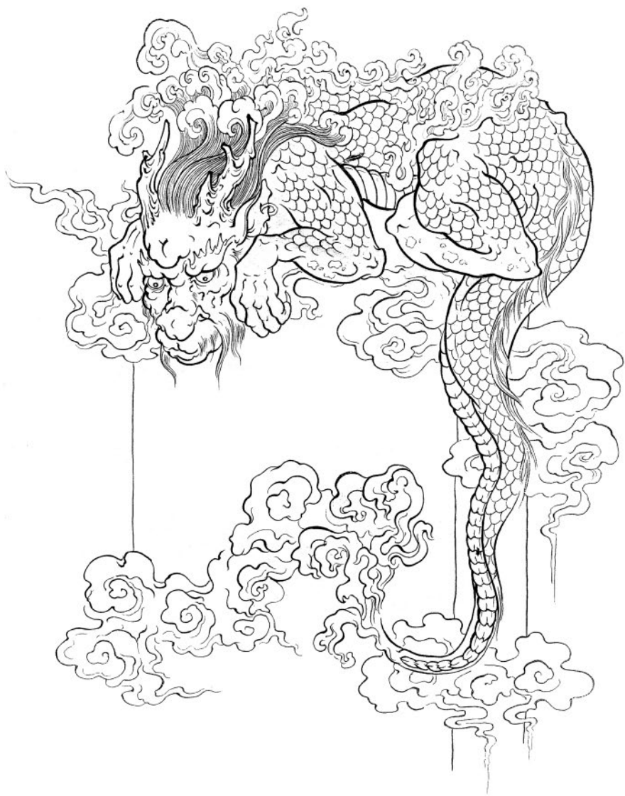
Фуси – дракон, который любит изящную словесность (из серии «9 сыновей Дракона»)