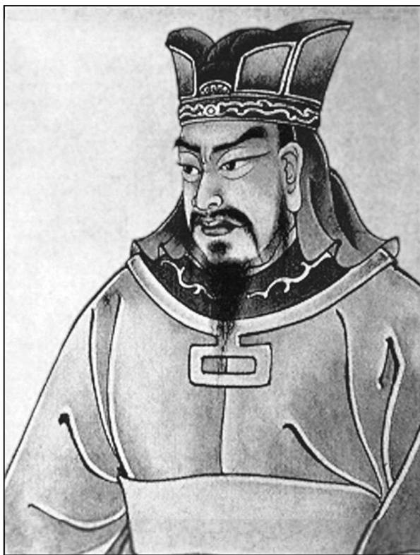
Сунь-цзы. Рисунок эпохи Цин

занимал трактат Сунь-цзы и в прежней Корее, и в феодальной Японии: и там это был авторитет во всех основных вопросах, касающихся войны.