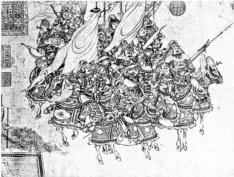
Китайская тяжелая кавалерия династии Сун. Живопись XII в.

правила и приказы? У кого войско сильнее? У кого офицеры и солдаты лучше обучены? 7 У кого правильно награждают и наказывают?