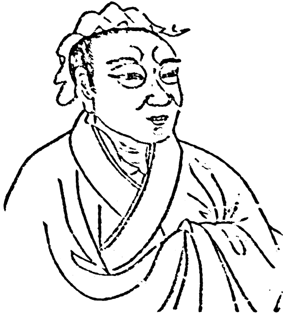
Сыма Цянь. Знаменитый китайский историограф

между собой царств. Именно тогда и сложилась доктрина Сунь-цзы как учение о захватнической войне в интересах рабовладельцев.