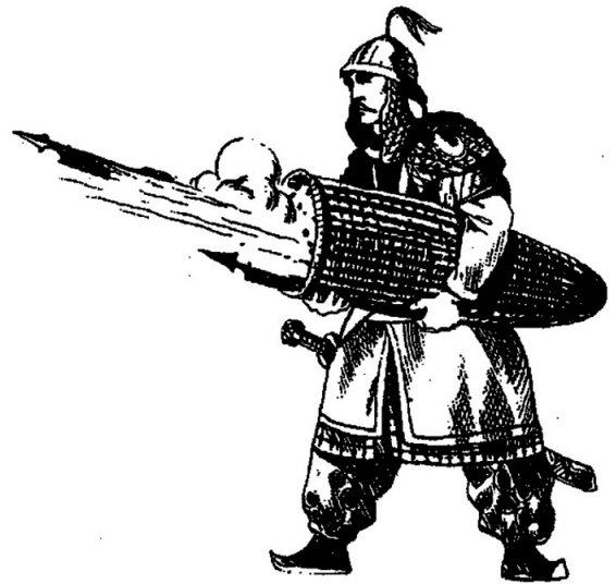
Боевые ракеты Древнего Китая

долженствующее победить, сначала побеждает, а потом ищет сражения; войско, осужденное на поражение, сначала сражается, а потом ищет победы.