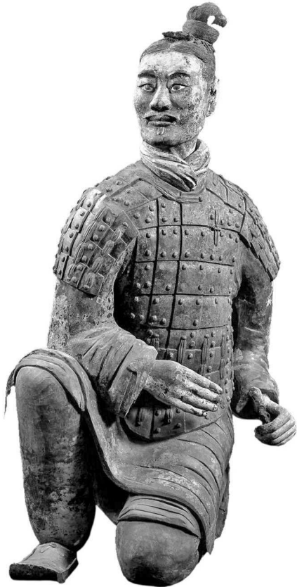
Офицер из усыпальницы первого императора Цинь Шихуанди. Сиань, Шэньси

Поэтому упорствующие с малыми силами делаются пленниками сильного противника.