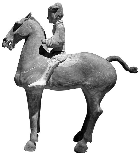
Всадник. 206 г. до н. э. — IX в. н.э. Сяньян, Шэньси

10. Силы подрываются, средства иссякают, у себя в стране — в домах пусто 3 ; имущество народа уменьшается на семь десятых; имущество правителя — боевые колесницы поломаны, кони изнурены; шлемы, панцири, луки и стрелы, рогатины и малые щиты, пики и большие щиты, волю и по-