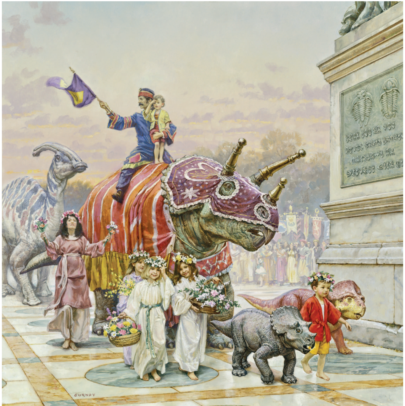
«Шествие в честь дня рождения», 1992. Холст, укрепленный на панели, масло, 74×74 см. Опубликовано в книге «Динотопия: мир под землей»