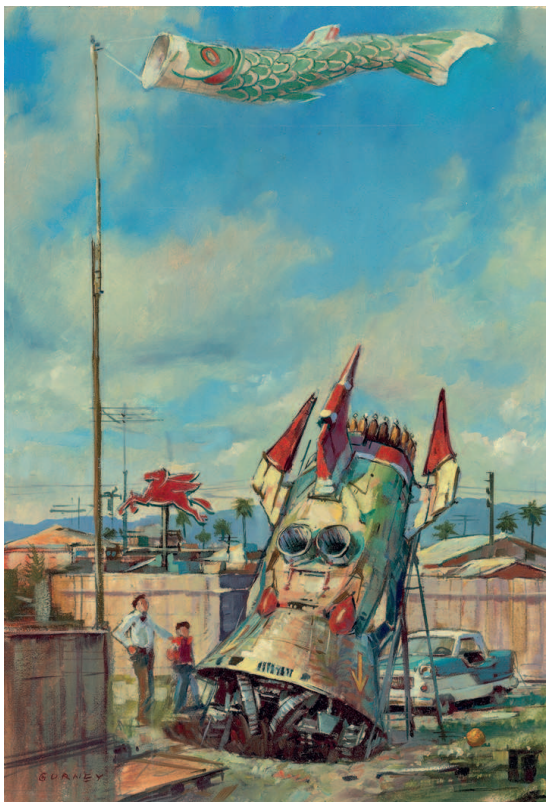
На этой странице: Эскиз к «Землеройному Левиафану», 1983. Масло, доска, 28×19 см.