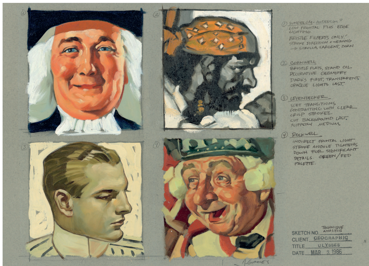
«Головы в изображении различных иллюстраторов», 1986. Картон, масло, 30х41 см.

В девятнадцатом веке студенты-художники усердно практиковались в копировании старых мастеров. Некоторые школы искусств снова стали поощрять такую практику. Это отличная идея, потому что вы сможете намного лучше понять, что именно делают ваши персонажи.