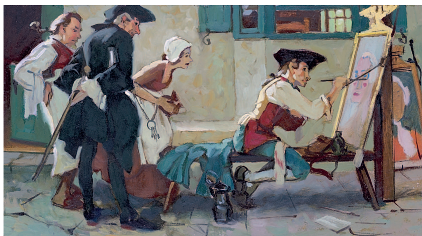
Копия «Новой вывески для таверны» Нормана Рокуэлла. Картон, масло, 16×31 см.