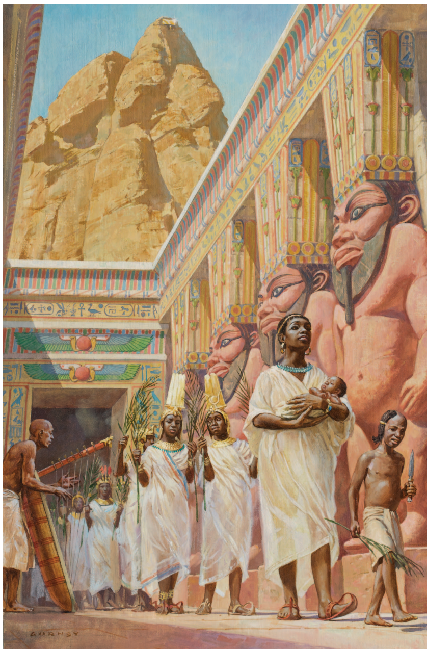
На предыдущей странице слева: «Ферма Уиндемов», 2006. Холст, масло, 28×36 см.

Раздел о композиции, начинающийся на стр. 155, отличается от большинства других руководств по дизайну, осно-