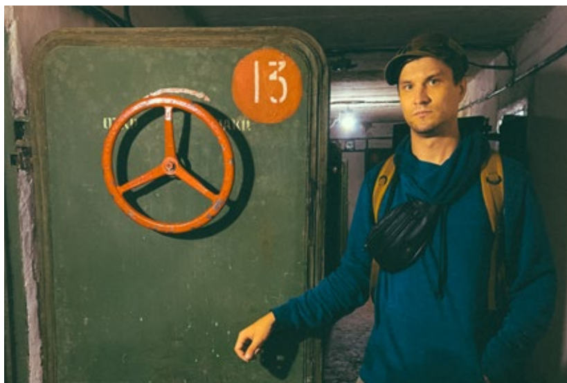
Автор возле приоткрытой герметичной двери в заброшенном бункере.