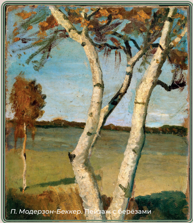
П. Модерзон-Беккер. Пейзаж с берёзами