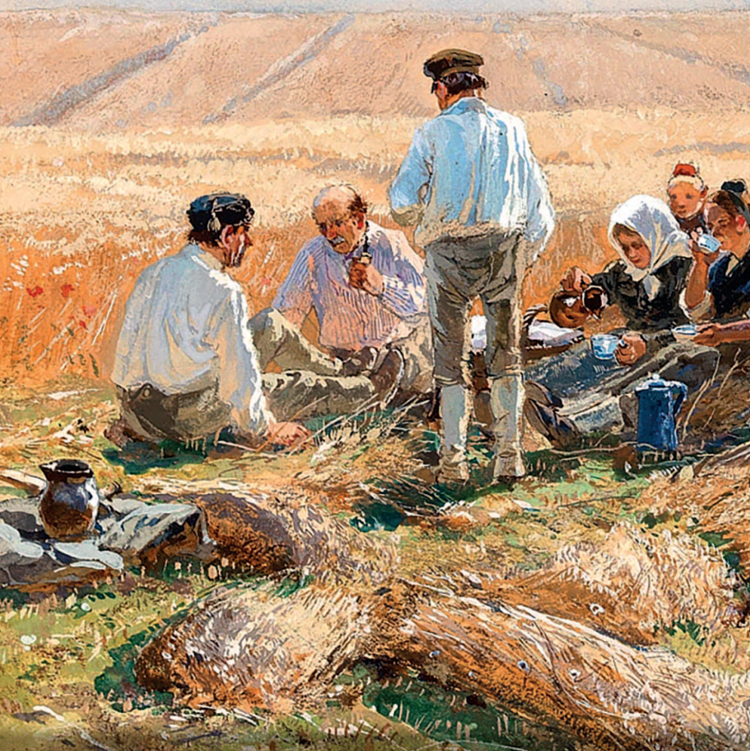
Х. Мюлиг. Отдых в полевых условиях