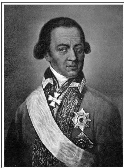
Генерал-аншеф Абрам Петрович Ганнибал (ок. 1669—1781)

область народной жизни не показывает ложности теории прогресса в такой мере, как это искусство. Так как война есть дело по преимуществу волевое, то само собой понимается, что если жизнь складывается так, что не вызывает необходимости энергического проявления воли, военное искусство должно по необходимости падать в той его части, которая относится к воле, т. е. в главнейшей. Чем этот упадок более, тем инстинкт самосохранения заявляет о себе сильнее и тем разные, даже мелочные, усовершенствования, отвечающие уму, т. е. самосохранению, оцениваются несравненно выше их действительного значения.