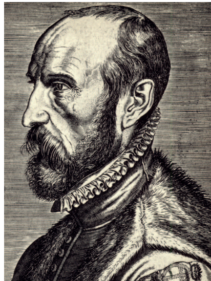
Сверху: Абрахам Ортелиус. Около 1575. Ортелиус был известным географом и близким другом Брейгеля Старшего. В своей «Книге друзей» он высоко оценивает творчество художника

К счастью, кроме Мандера существует и другой источник информации о жизни художника — Абрахам (Авра-