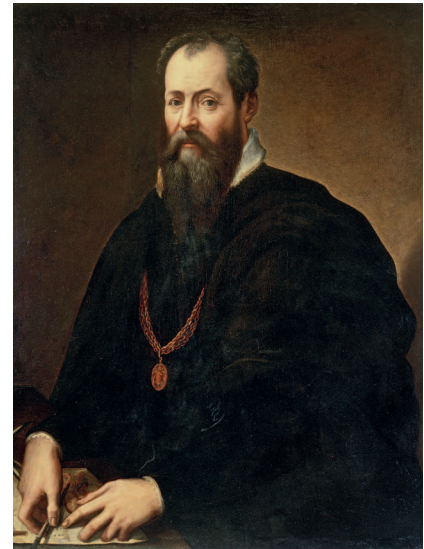
Сверху: Джорджо Вазари. Автопортрет. 1566—1568. Автор «Жизнеописаний» называл Брейгеля вторым Босхом

Итальянец Людовико Гвиччардини жил в Антверпене и был знаком