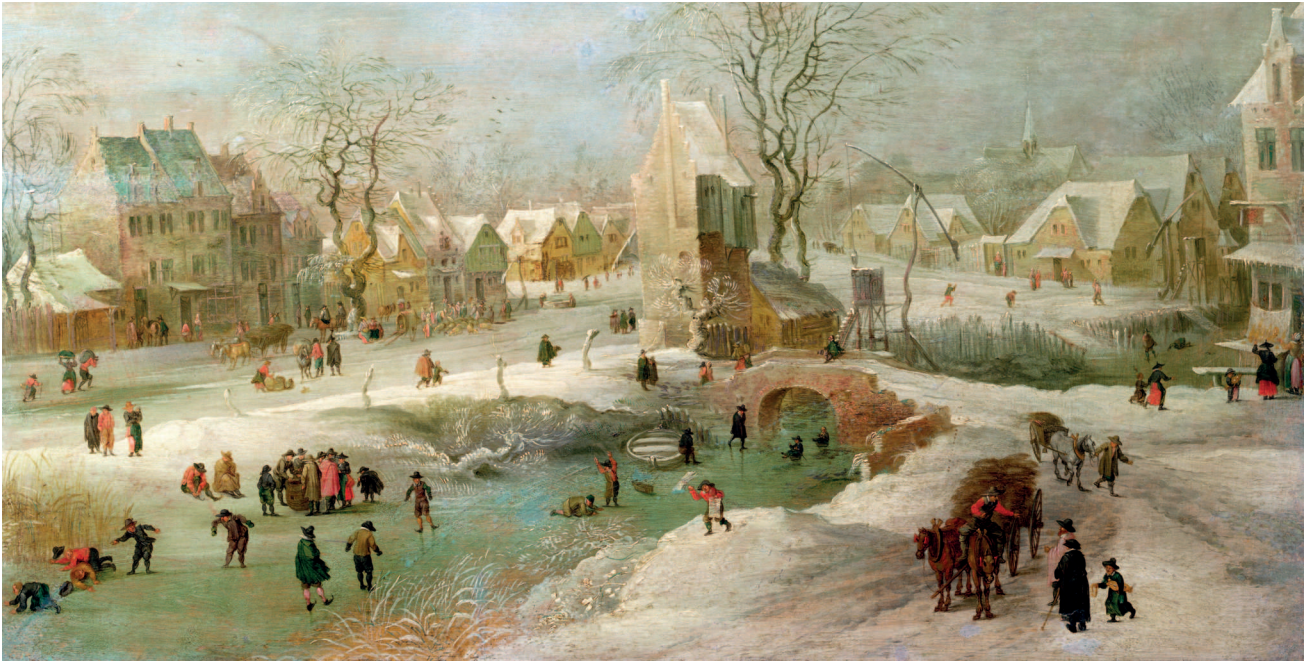
Сверху: Ян Брейгель Старший. Голландия зимой. Около 1600. Младший сын Брейгеля передал типичный городской зимний пейзаж, хотя в живописи он более изобретательный и творческий, чем его старший брат, Питер Младший

в 1568 г. Вазари лично знал некоторых мастеров, о которых писал. Он считается основоположником современного искусствознания. Вазари слышал о Брейгеле Старшем и называл его вторым Босхом.