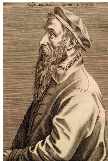
Сверху: Доминик Лампсоний. Питер Брейгель Старший. Гравюра. 1572. На этом посмертном изображении художник показан серьезную и даже величественным

На некоторых наиболее известных работах художника изображены крестьяне, поэтому живописца иногда называют Брейгелем Крестьянским. Некоторые специалисты считают, что