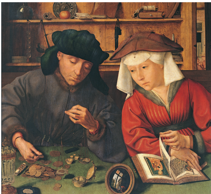
Сверху: Квентин Массейс. Меняла с женой. Около 1514. Прекрасная работа одного из предшественников Брейгеля Старшего, на которой художник с юмором, в реалистичной манере изобразил менялу с женой

наиболее выдающихся работ считается «Мадонна канцлера Ролена» (см. стр. 17), созданная в 1435 г. Пышно одетые канцлер и Мадонна на переднем плане внушительны, но взгляд зрителя скользит мимо сияющего интерьера, через арки — к далекому пейзажу речной долины, выполненному с мастерством отображения света и пространства.