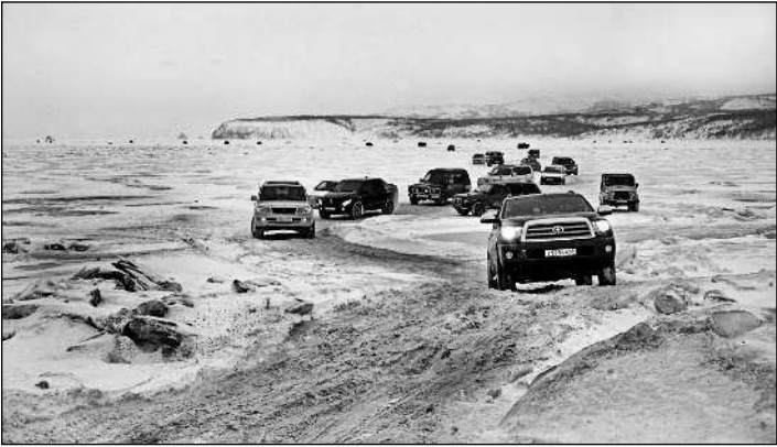
В бухте Гертнера. Магаданцы едут с рыбалки

почитает в этом сезоне зубарь , какую — малоротка и какое расстояние между крючками на самодуре оптимально. Где достать лучшего морского червя, где безопасно передвигаться по льду на «дэлике», как проехать «на Зелёнку» или на «дэ-эр» (место бывшей дисциплинарной роты). В Амурском заливе в черте Владивостока есть остров Скребцова, который все зовут Коврижкой. Подальше — другой островок, он называется Речным, но все зовут его Второй Коврижкой. Пространство между первой и второй Коврижками недипломированные филологи в просоленных тулупах снайперски прозвали Межковрижьем.