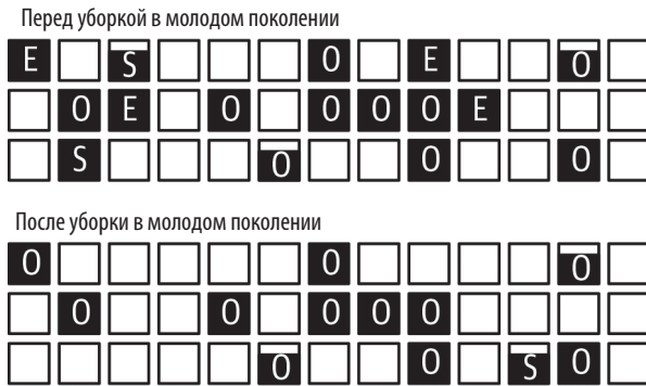
Рис. 6.4. Уборка мусора G1 в молодом поколении

Каждый квадратик на диаграмме представляет область уборки мусора G1. Данные в каждой области представляются черным цветом, а буква обозначает поколение, к которому принадлежит область: [E] — Эдем (Eden), [O] — старое поколение (Old generation), [S] — область выживших (Survivor space). Пустые области не принадлежат поколениям; алгоритм G1 произвольно использует их для того поколения, которое сочтет нужным.