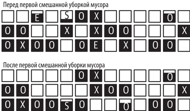
Рис. 6.6. Смешанная уборка, выполняемая уборщиком мусора G1

Теперь уборщик мусора G1 выполняет серию смешанных уборок мусора. Они называются «смешанными» (mixed), потому что выполняется нормальная уборка мусора в молодом поколении, но также в ней задействованы некоторые помеченные области из фонового сканирования. Эффект смешанной уборки мусора показан на рис. 6.6.