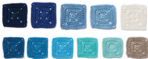
Палитры 5 и 6: Сочетание основных цветов с их различными оттенками создает привлекательный эффект