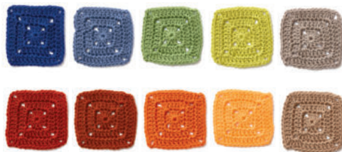
Палитры 3 и 4: Сочетание основных цветов с аналогичными и нейтральными цветами выглядит мягче