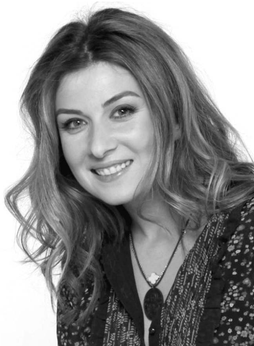
Жанна Бадоева – идейный вдохновитель и ведущая проекта «Орел и решка»