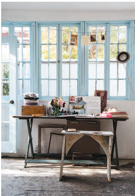
Венеция, Калифорния, 2017 г. Мой рабочий кабинет, где я начала работу над своим Оракулом.