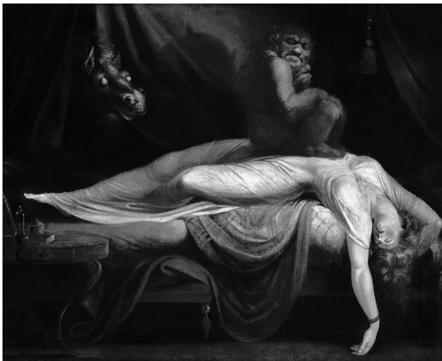
«Ночной кошмар» , Джон Генри Фюзели (1781)