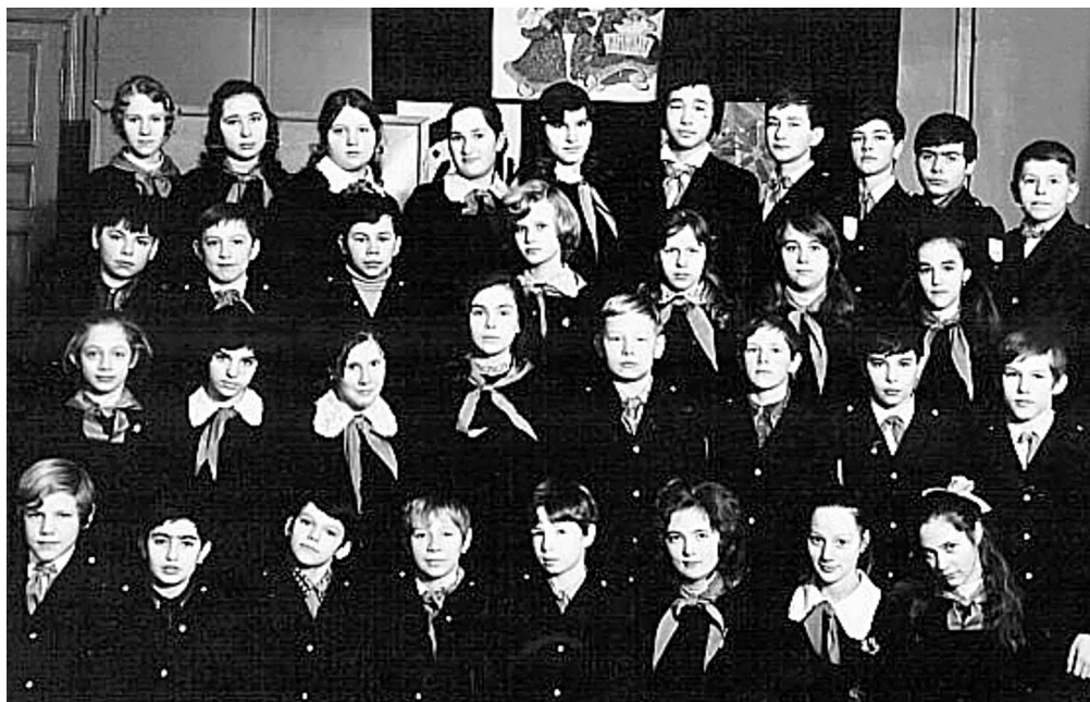
▲ В школе.