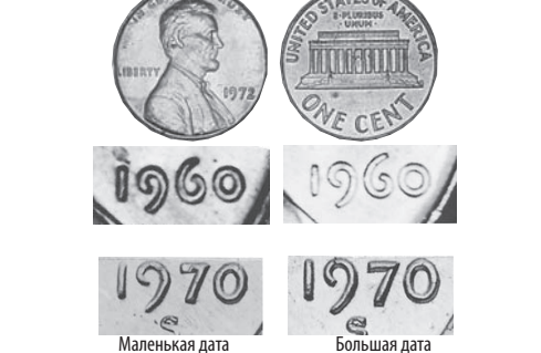
Маленькая дата Большая дата