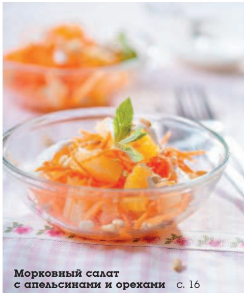
Морковный салат с апельсинами и орехами с. 16