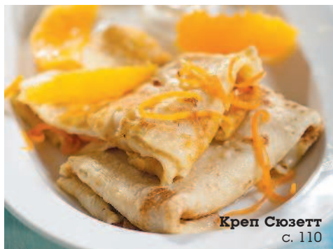
Креп Сюзетт с. 110