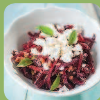
Свекольный салат с орехами, брынзой, базиликом