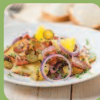
Немецкий картофельный салат с беконом