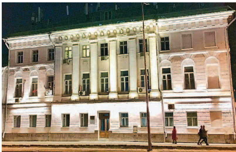
Первая московская мужская гимназия

ворот. Данная гимназия находилась в ведении Московского университета.