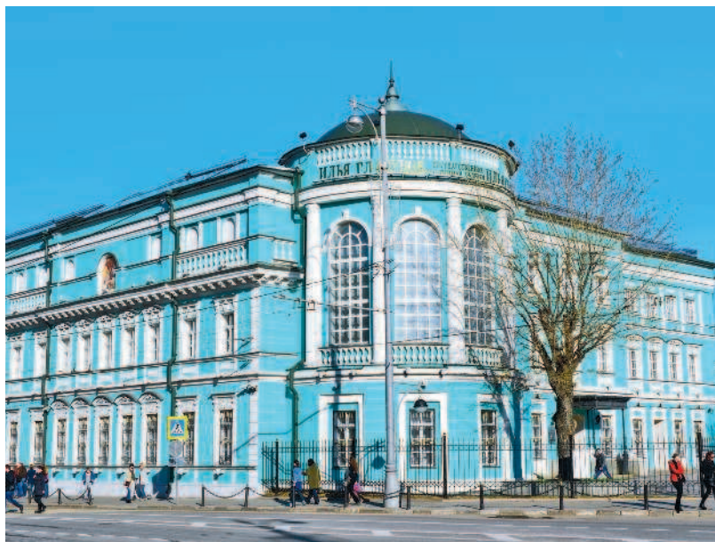
Галерея Ильи Глазунова