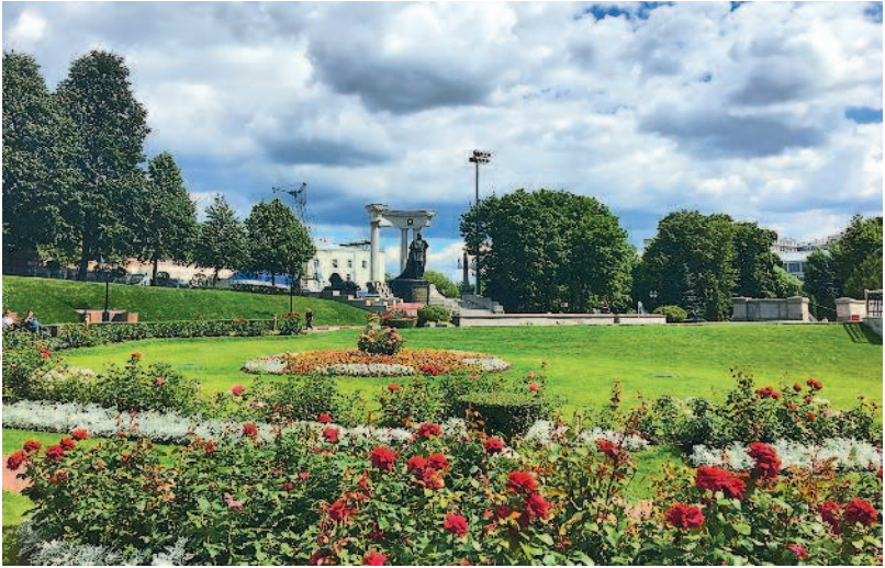
В парке при храме Христа Спасителя

известными художниками той эпохи. Храм Христа Спасителя был построен в благодарность за заступничество Всевышнего и как памятник народному мужеству, проявленному в войне 1812 года.