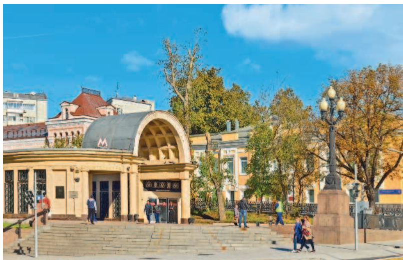
Выход из станции метро «Кропоткинская»

Хотите почувствовать себя настоящими городскими туристами? Отправляйтесь на станцию метро «Кропоткинская». Мы начинаем наш путь по Волхонке от площади Пречистенские ворота по направлению к самому центру столицы.