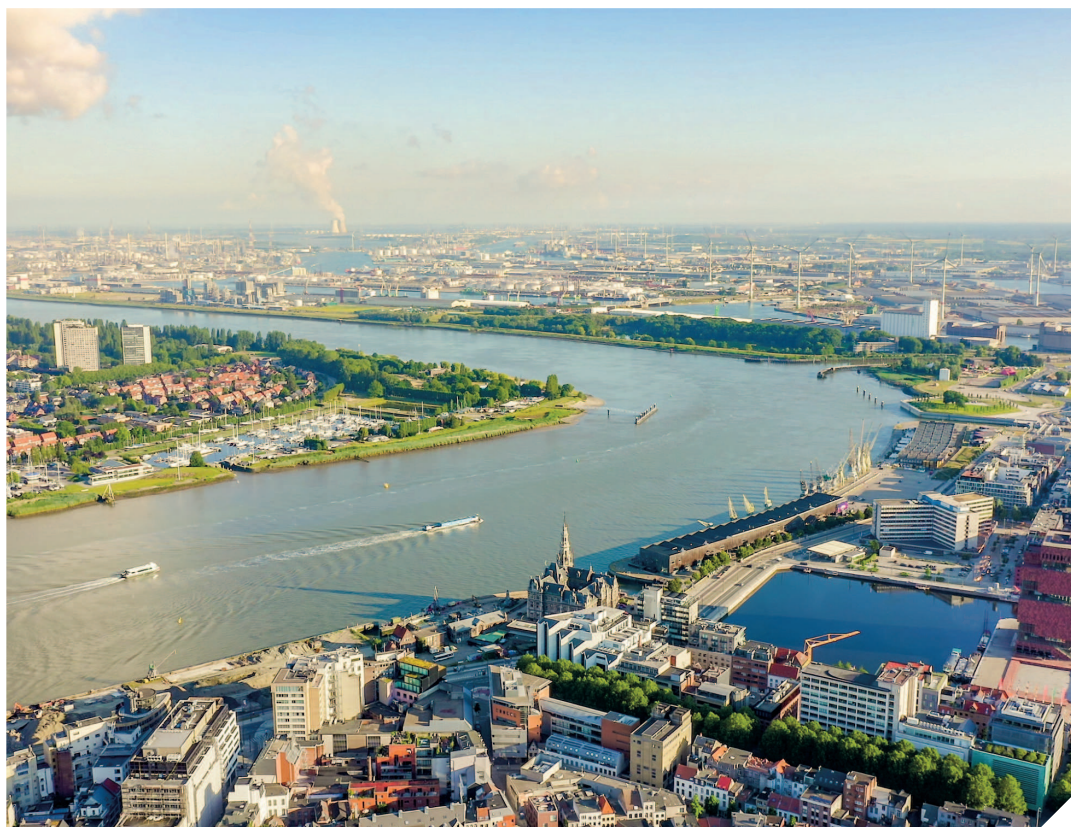
Антверпен раскинулся на берегах реки Шельды.

А нтверпен — второй по величине город Бельгии и один из самых значимых портов Европы. Однако его сердце бьется не только в ритме экономики, но и в ритме искусства, моды и кулинарных традиций. Этот город известен своим богатым историческим наследием, уникальной архитектурой и культурным разнообразием. Здесь старинные улицы соседствуют с современными зданиями, а аромат кофе в уютных кафе перемешивается с духом истории, которым веет от древних строений. Множество музеев, галерей и театров, наряду с современными торговыми центрами и ресторанами, делают его притягательным как для любителей истории, так и для поклонников современных тенденций.