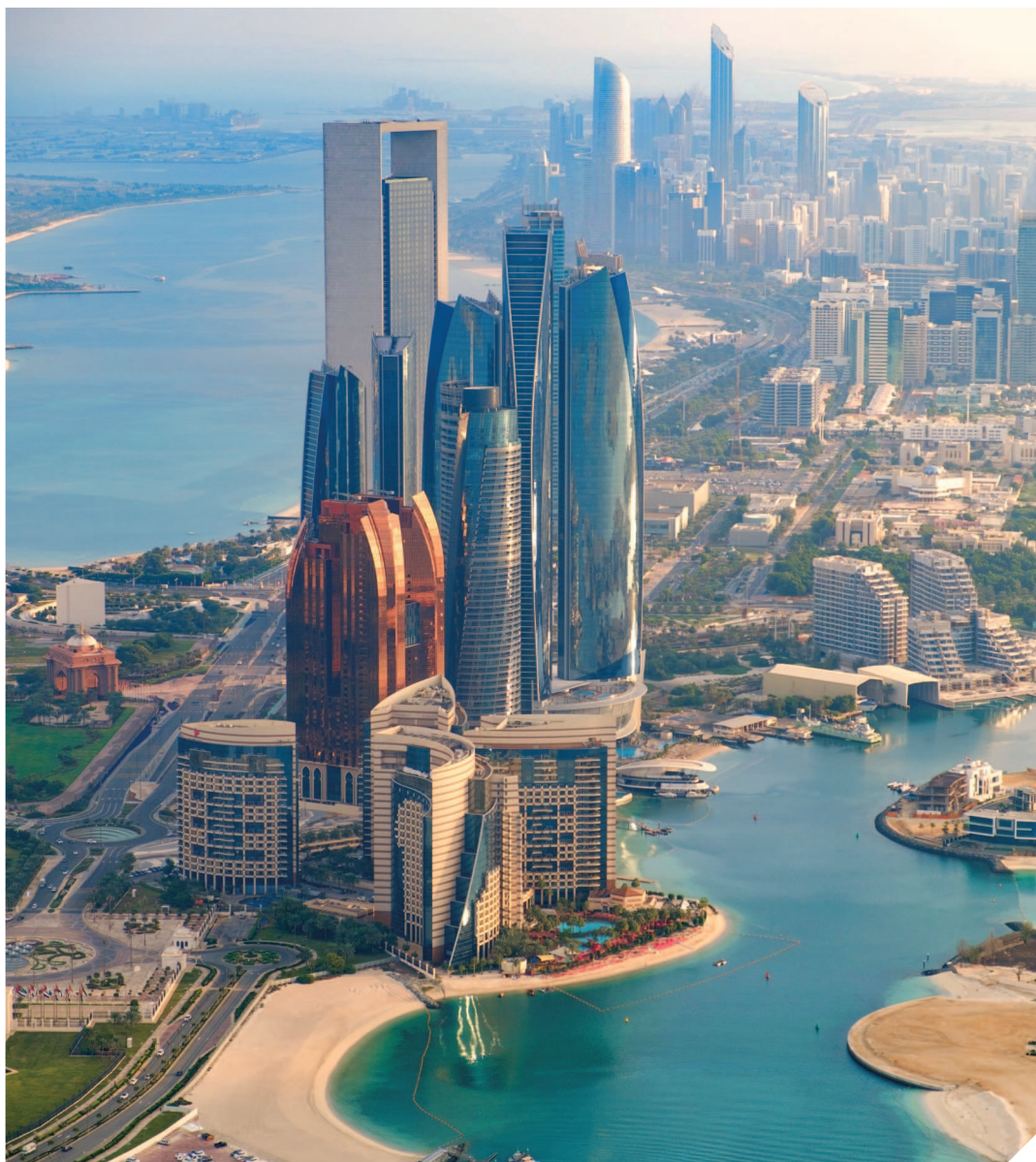
Абу-Даби расположен на нескольких островах Персидского залива.

А бу-Даби, столица Объединенных Арабских Эмиратов, удивительным образом сочетает в себе многовековые традиции Востока и самую современную архитектуру. Этот город является одним из самых богатых и динамично развивающихся мегаполисов в мире. Хотя Абу-Даби ассоциируется с современностью, его история насчитывает сотни лет. Название города переводится как «Отец газели», что связано с легендой о том, как поселенцы охотились за газелью, которая в конечном итоге привела их на остров, к источнику пресной воды. В благодарность газель отпустили, а вокруг источника и был основан город.