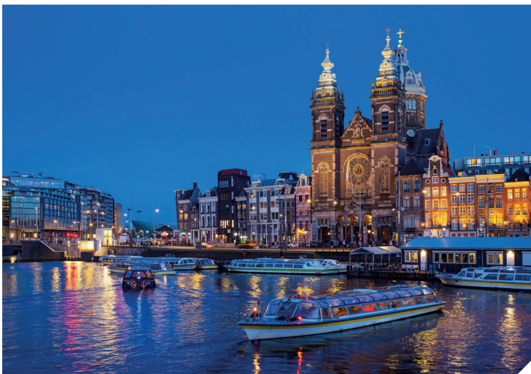
Церковь Святого Николая — одна из красивейших в Амстердаме.