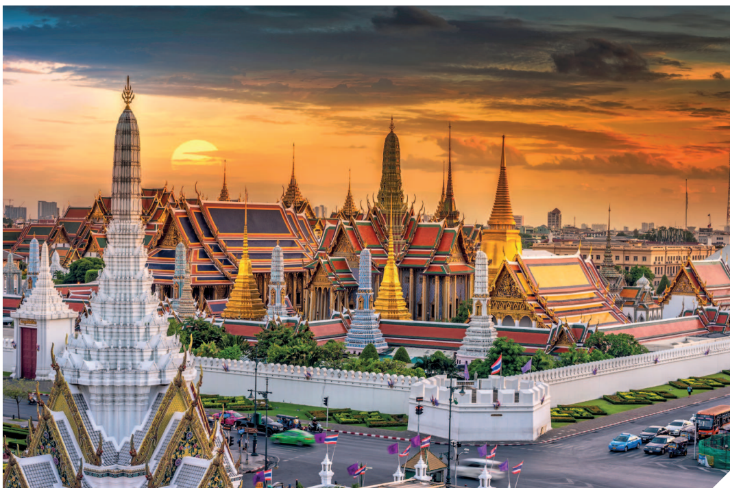
Храм Изумрудного Будды находится на территории Королевского дворца.

Ксо). Этот великолепный храм считается самым священным местом в Таиланде. Внутри храма находится статуя Будды, вырезанная из цельного нефритового камня, прикоснуться к которой имеет