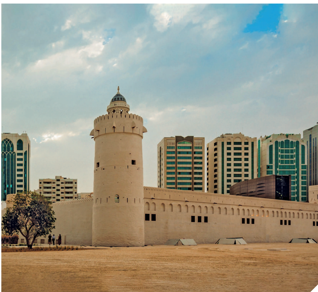
Каср аль-Хосн построен в традиционном арабском стиле.