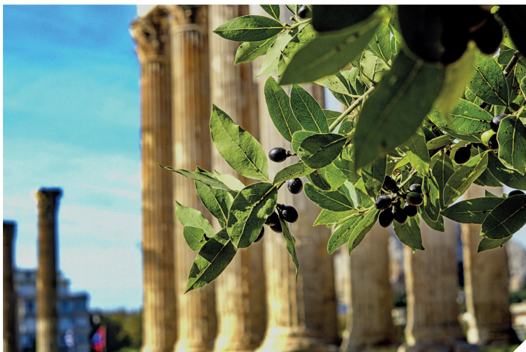
Оливковое дерево считается в Афинах священным.