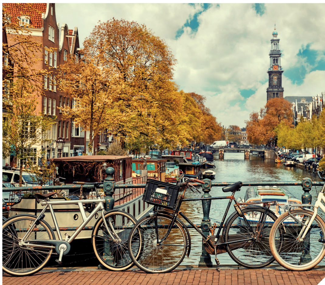
В Амстердаме насчитывается около 900 тыс. велосипедов.

Еще одна особенность города — его велосипедная культура. Амстердам называют «велосипедной столицей Европы». Здесь насчитывается около 900 000 велосипедов, что даже больше, чем основного населения. В Амстердаме велосипед не просто транспорт, а образ жизни. Более 60 % жителей столицы Нидерландов ежедневно используют велосипед для передвижения, будь то поездки на работу, учебу или встречи с друзьями. В городе проложено более 400 км велодорожек, построены специальные парковки и даже функционируют «велосипедные светофоры». Амстердамцы выбирают велосипеды за их экологичность, удобство и экономичность. Им неважно, какой у тебя велосипед — старенький или современный, главное, что он помогает избежать пробок и сделать город чище.