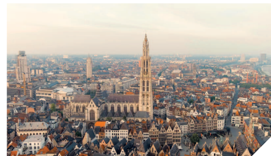
Над историческим центром Антверпена доминирует величавый собор Антверпенской Богоматери.

По бокам узеньких мощеных улиц стоят старинные здания в стиле ренессанс и барокко, а рядом с ними — широкие проспекты и ультрасовременные архитектурные сооружения. Исторический центр города, где на каждом шагу встречаются уютные кафе и магазины, напоминает музей под открытым небом. Здесь также расположены известные достопримечательности города, например площадь Гроте-Маркт с великолепной ратушей и старинными домами. Антверпен — город музеев. Их здесь более десятка, от огромного 10-этажного комплекса MAS и Королевского музея изящных искусств до камерного музея бриллиантов и небольших частных музеев. Антверпен гордится уроженцем города Рубенсом, шедевры которого хранятся в соборе Антверпенской Богоматери и доме-музее Рубенса.