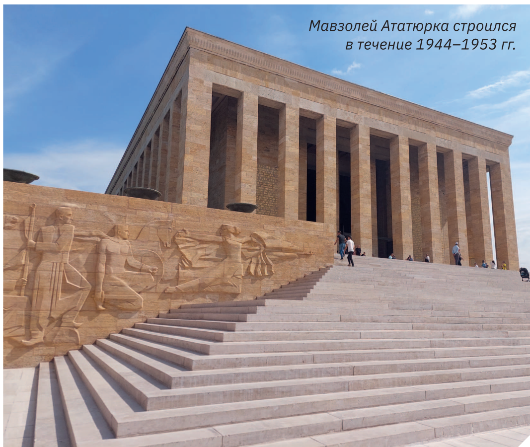
Мавзолей Ататюрка строился в течение 1944–1953 гг.