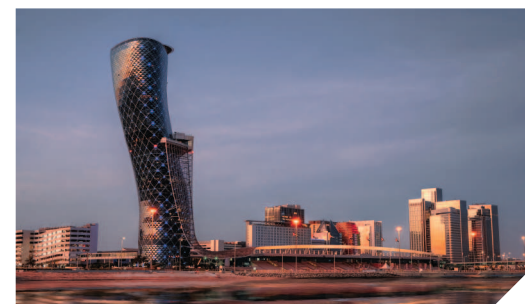
Небоскреб «Падающая башня» наклонен под углом 18 градусов и достигает высоты 160 м.