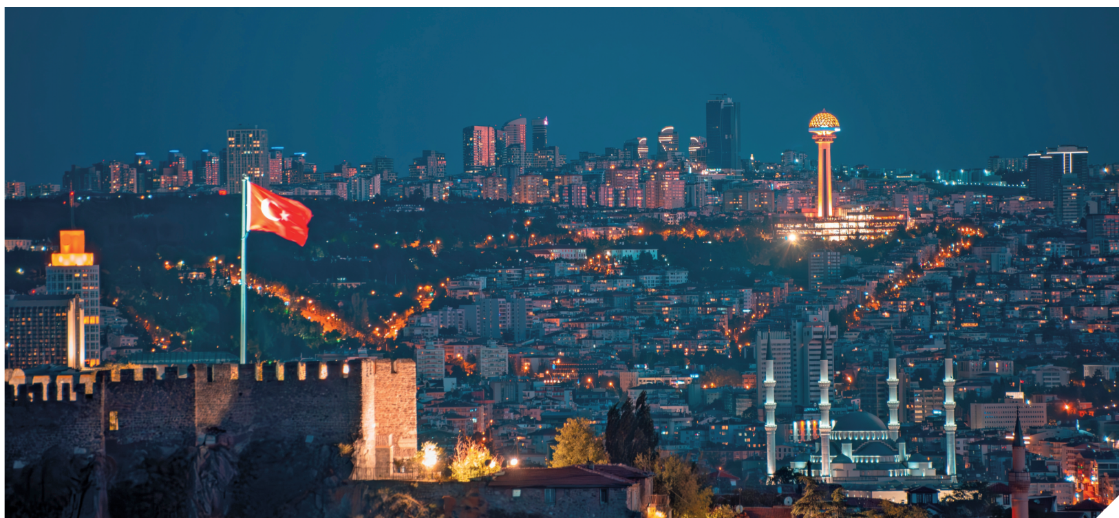
Анкара располагается на живописных холмах Центральной Анатолии.

развиваться. В это время были построены мечети, которые до сих пор украшают вид города: мечеть Алаэддина, возведенная в XIV в., мечеть Хаджи Байрама, сооруженная в XV в. на месте византийской церкви, мечеть Йени, самая большая османская мечеть в Анкаре, построенная в XVI в.