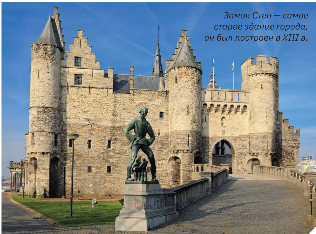
Замок Стен — самое старое здание города, он был построен в XIII в.

что в переводе с нидерландского означает «бросать руку», так и популярному лакомству.