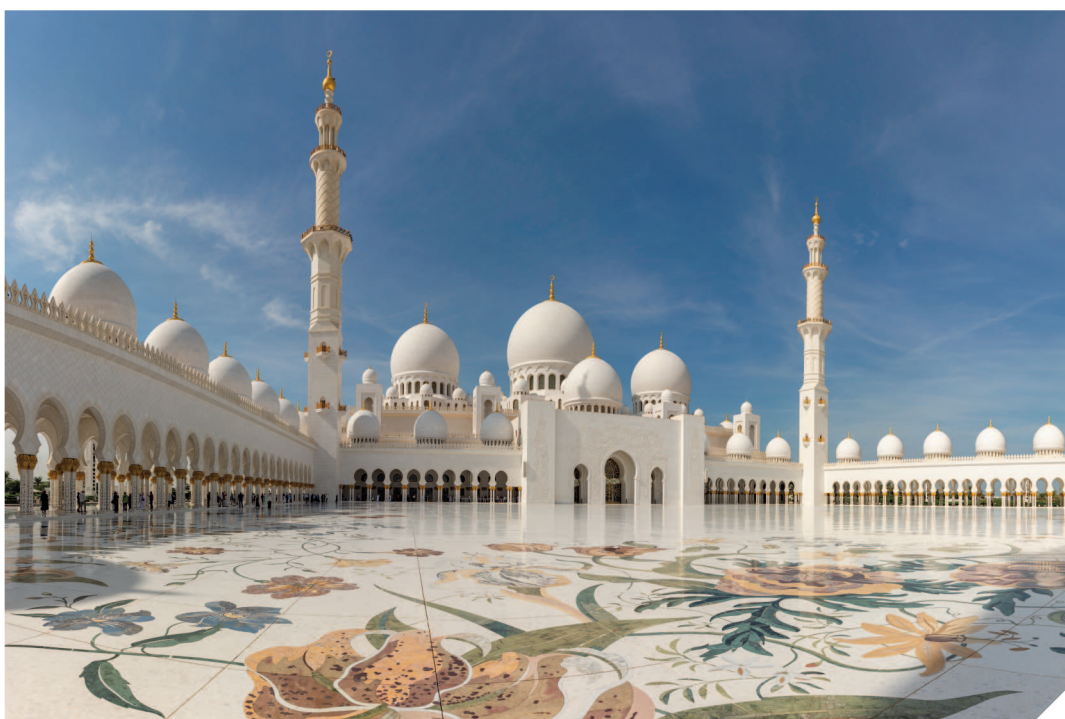
Мечеть шейха Зайда является одной из самых больших мечетей в мире.

Главной исторической достопримечательностью Абу-Даби является Каср аль-Хосн, также известный как Старый форт. Этот величественный комплекс считается самым старым зданием в городе и его символом. Построенный в конце XVIII в. для защиты единственного источника пресной воды на острове, на протяжении более 200 лет форт служил резиденцией правящей семьи Аль Нахьян и административным центром всей области. Внутри можно увидеть реконструированные жилые помещения, башни и дворы, которые демонстрируют, как в прошлом выглядели королевские покои.