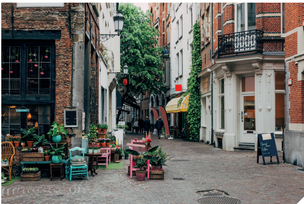
На узких мощеных улочках исторического центра царит уютная, истинно европейская атмосфера.