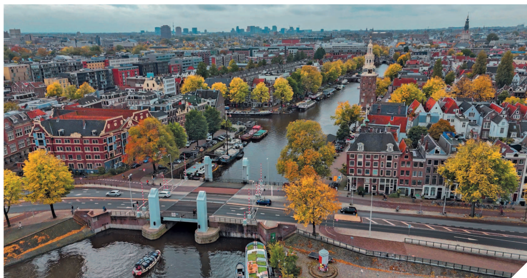
Амстердам — шестая по величине европейская столица.