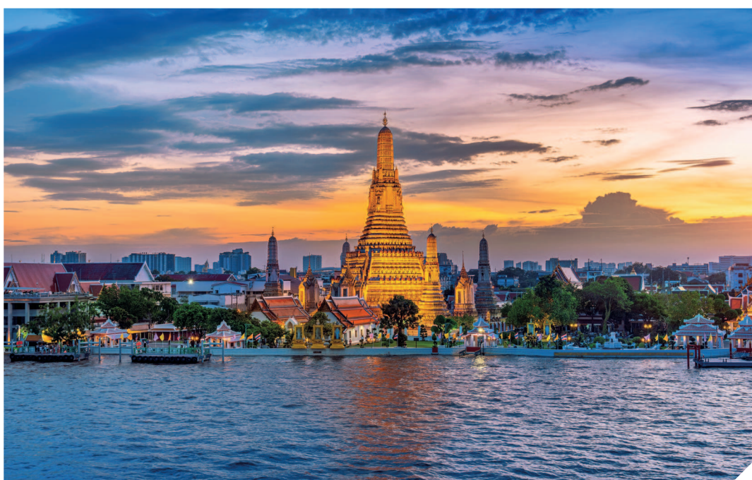
Храм Зари сочетает в себе буддийские и индуистские элементы.

право лишь король или наследный принц. Именно они переодевают ее в разные наряды в зависимости от времени года. Рядом с храмом расположены архитектурные сооружения храмового комплекса, отделанные золотыми плитками и тонкой резьбой.