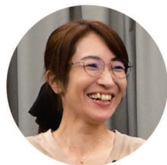
Х.-сан, 44 года