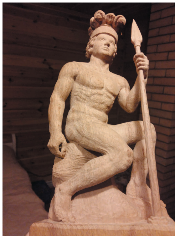
Ил. 7. Фигура Героя в двух стадиях: готовая и неоконченная. Копье ориентировано строго по волокам дерева, иначе легко обломится. Бук. 2018 г