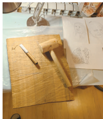
Ил. 3. Начало работы. Почти плоская стамеска, которой нанесены первые удары. Ей больше полувека, но она до сих пор выдерживает удары киянкой. На доске обозначены контуры будущих портретов