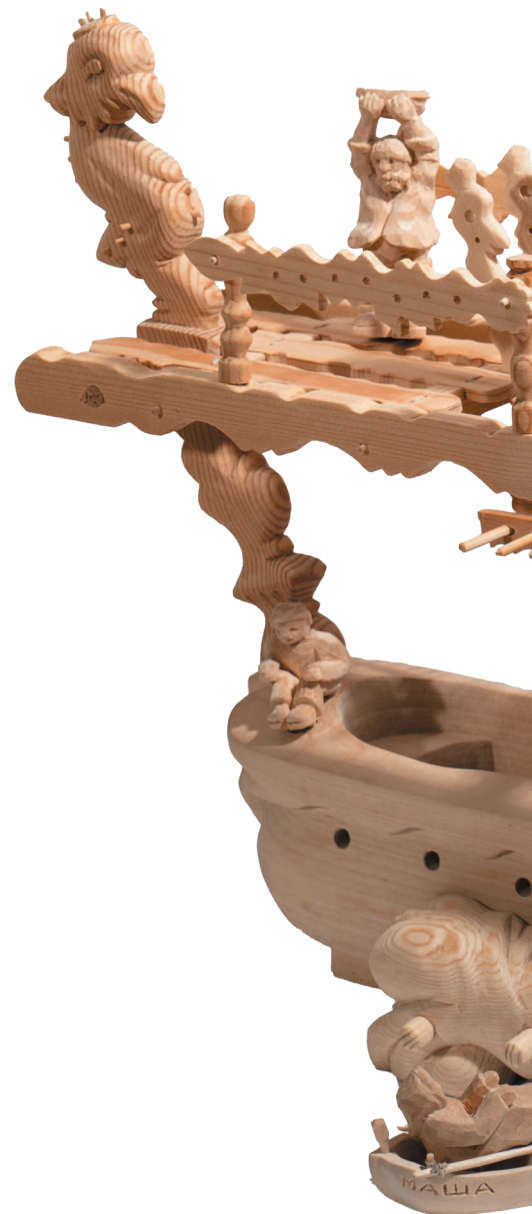
Ил. 6. Кораблик. 2023 г