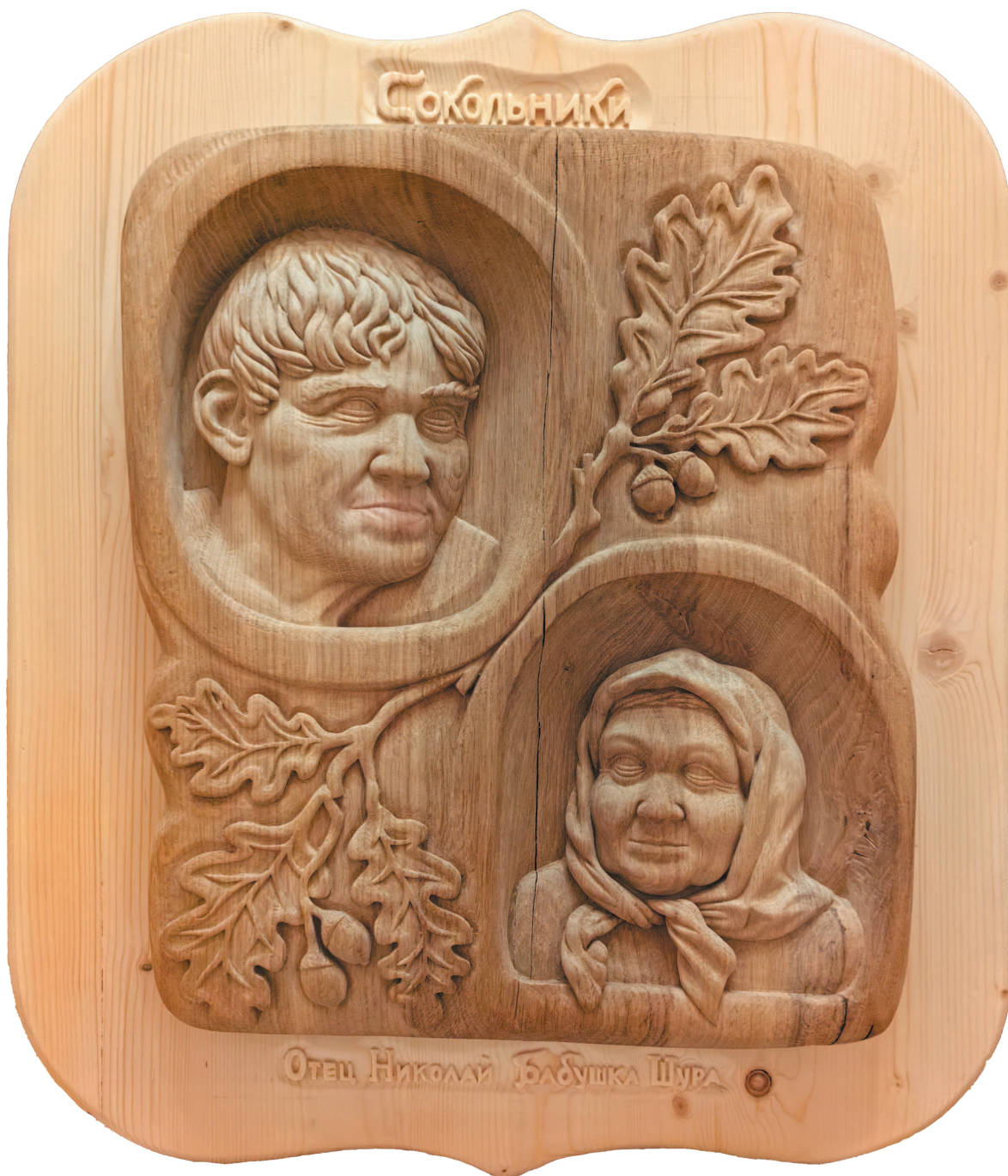
Ил. 2. Барельеф с портретами отца и бабушки. Основная часть — дуб, фон — сосна. 2024 г