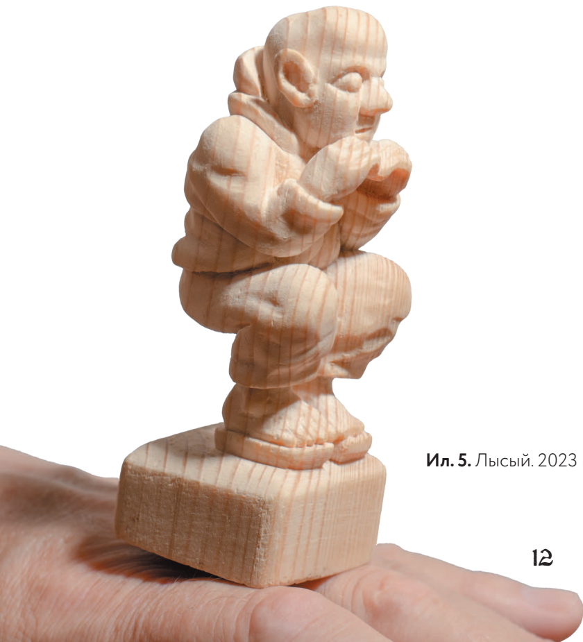
Ил. 5. Лысый. 2023 г

Теперь немного мистики. Портреты были уже хорошо продвинуты, когда супруга усомнилась: уместно ли помещать отца и бабушку (зятя и тещу) рядом. Вскоре доска неожиданно упала, а на каменном полу образовалась трещина. Я стал ставить более устойчиво, но через некоторое время произошло странное: доска, поставленная вертикально на стул, вдруг сама упала,