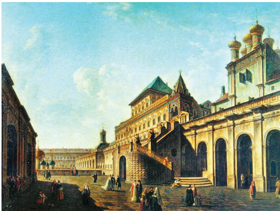
Вид на Терема с не существующей ныне Боярской площадки Государева двора. Картина Ф. Алексева, 1801

каменным здесь становится не только подавляющее большинство жилых домов, но и отдельные надворные постройки.