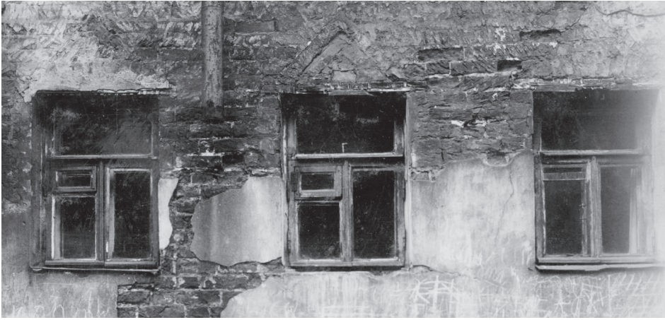
Наличник XVII в., скрывающийся под поздней штукатуркой Братского корпуса на Варварке. Фото начала 1960-х