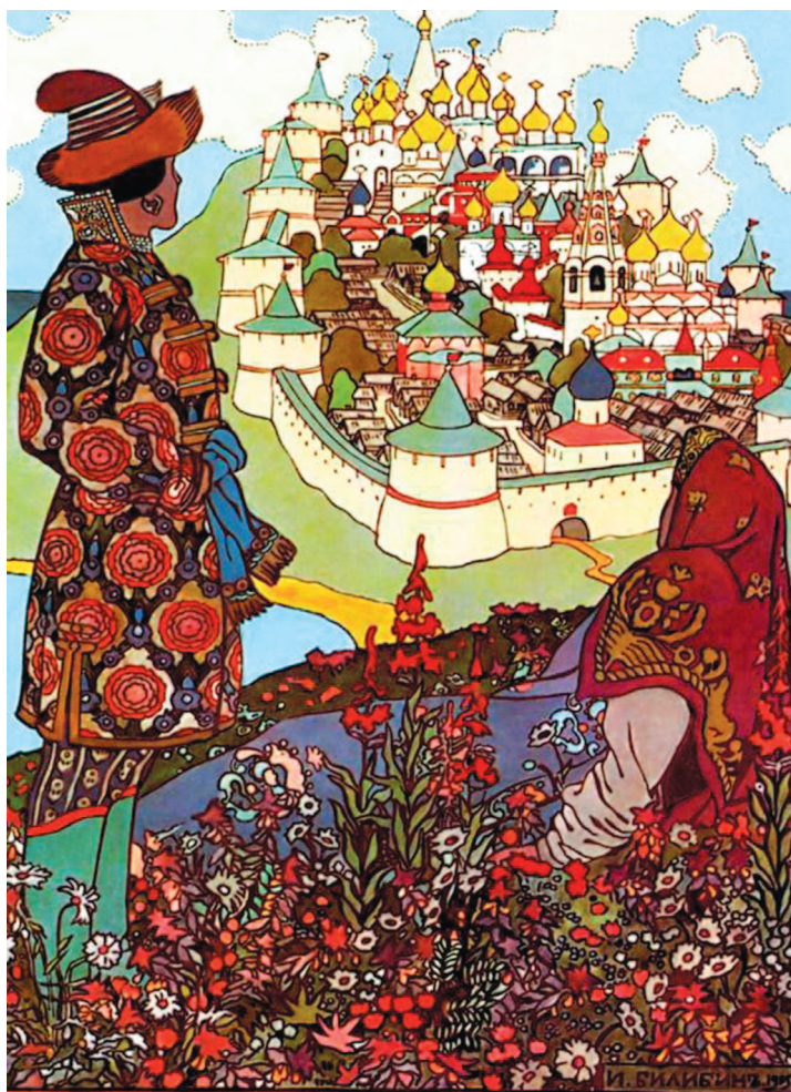
«На наш взгляд современного человека, это был огромный музей сокровищ». И. Билибин, иллюстрация к «Сказке о царе Салтане», 1905

Выше Теремка были только купола кремлевских соборов. А сейчас скрытый поздними зданиями Теремной дворец можно увидеть только с самых ближних ракурсов в самом Кремле и с двух-трех случайных точек вне его. Не говоря о том, что интерьеры легендарного памятника, находящегося на закрытой территории, для подавляющего большинства москвичей и гостей столицы по-прежнему существуют лишь на картинках.