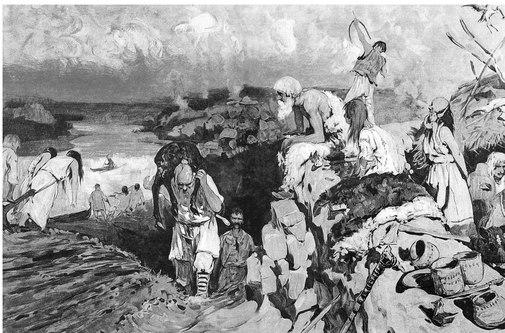
С.В. Иванов. Сцена из жизни восточных славян

них был Перун, бог грома и молнии; — поклонялись также солнцу под разными именами (Дажбога, Волоса), огню, ветру. Верили в загробную жизнь, думали, что души умерших могут есть, пить, и потому считали обязанностью угощать их. Общественного богослужения, храмов, жрецов у них не было; старшины или родоначальники были и жрецами, приносили жертвы.