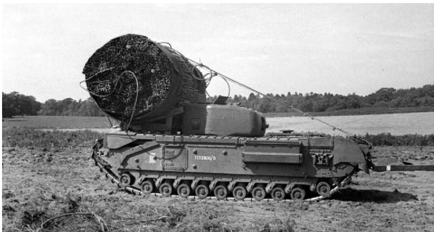
«Игрушки Хоббарта». Танк AVRE с фашиной для заполнения воронок и противотанковых рвов.

Финальный план операции «Оверлорд» выглядел следующим образом: весь фронт вторжения был разделен на два сектора ответственности – западный американский и восточный британский. Это разделение определялось географией размещения войск на Британских островах. В западном секторе 1-я армия США генерала Омара Брэдли силами трех пехотных дивизий будет высаживаться на участках «Юта» и «Омаха». Дополнительно две американские воздушно-десантные дивизии – 82-я и 101-я, прикроют западный фланг плац-