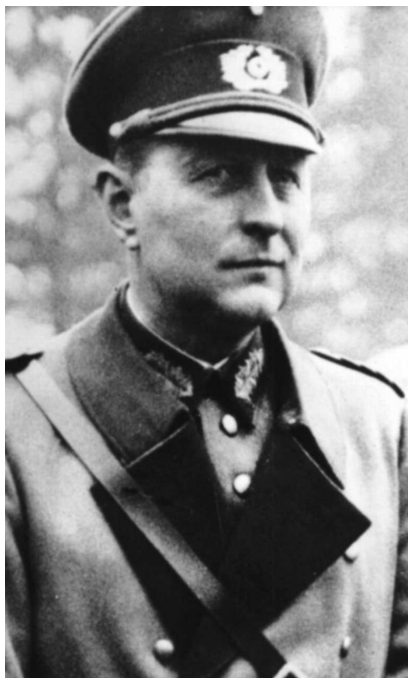
Командующий танковой группы «Запад» генерал Лео Гайр фон Швеппенбург.

ным условием для Германии избежать полного разгрома на Востоке. «Сбросив в море силы вторжения, мы отобьем у врага желание пытаться еще раз», – указывал Гитлер в Директиве. «Поражение нанесет серьезный удар по моральному духу англичан и американцев». После того, как ситуация на Западном фронте будет должным образом разрешена, 45 дивизий, расположенных в Европе, можно будет перебросить на Восточный фронт, чтобы нанести сокрушительное поражение Красной армии. «Вот поэтому весь исход войны и судьба самого Рейха зависят сейчас от каждого бойца, сражающегося на Западе».