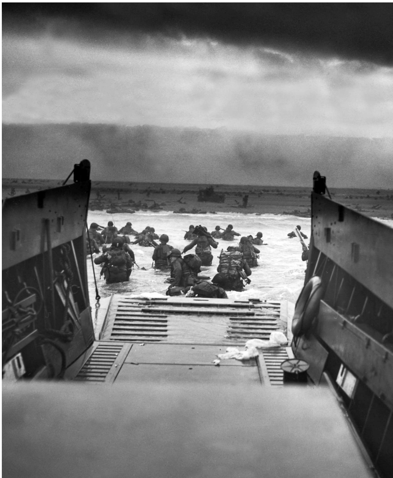
Высадка американской штурмовой пехоты роты «Е» 16-й ПБГ 1-й пехотной дивизии с десантных катеров на участке «Омаха» под плотным пулеметным огнем немцев.