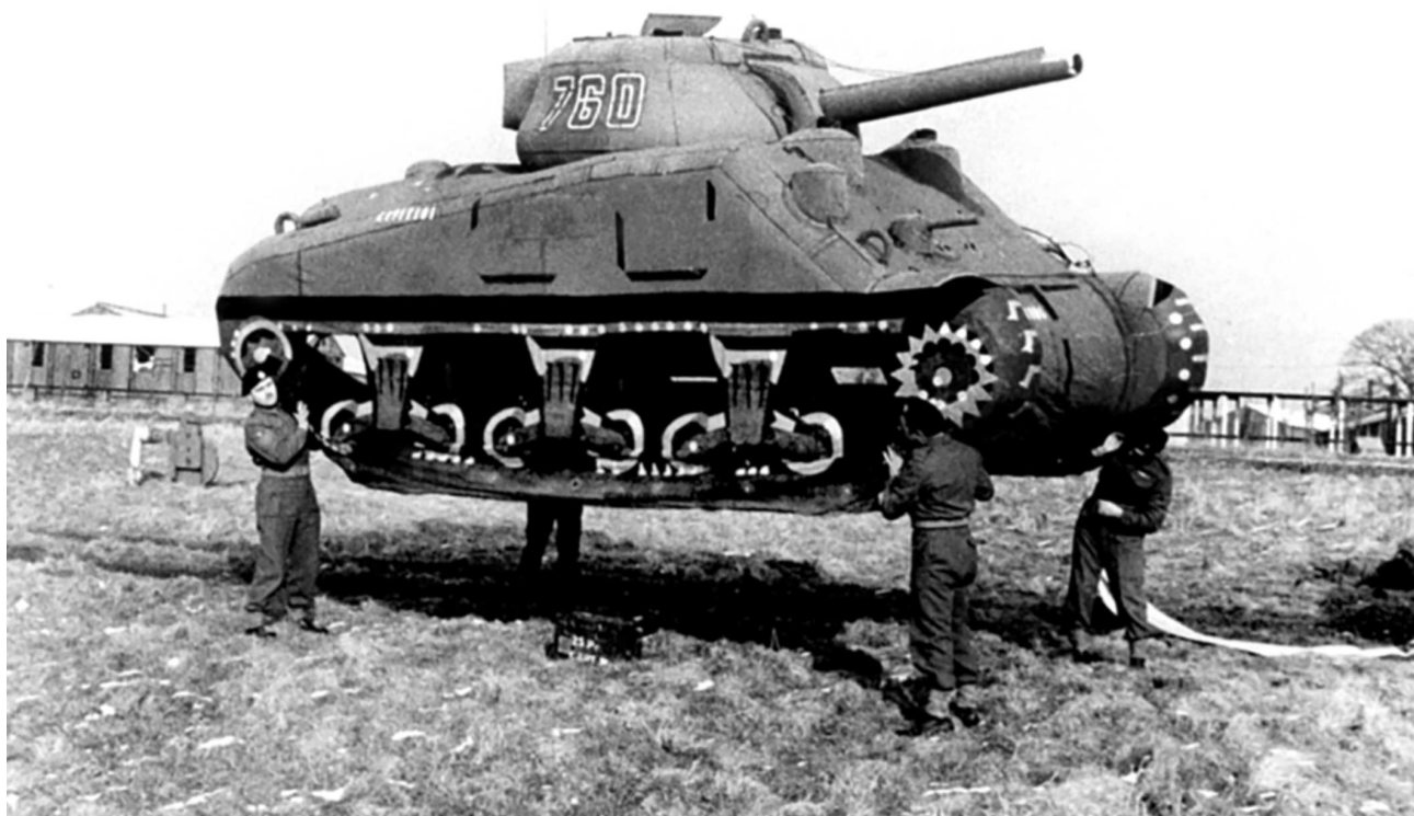
Надувной макет американского танка М4 «Шерман» на юге Англии. Подобные муляжи военной техники использовались в рамках операции «Фортитюд» для имитации развертывания ложных армий союзников в Эдинбурге и на юге Англии, целью которой было отвлечение внимания немцев от Нормандии.