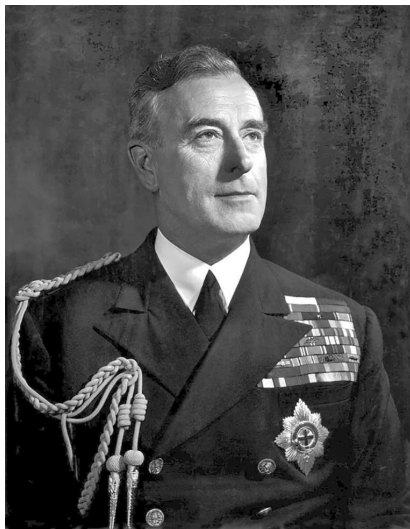
Лорд Луис Маунтбеттен, под началом которого были разработаны основные принципы будущего вторжения союзников на Европейский континент.

Осенью 1940 года, едва лишь миновала угроза немецкой высадки на Британские острова, Черчилль в радиообращении заверил население оккупированной Франции, что ждать освобождения осталось недолго – экспедиционный корпус союзников обязательно вернется на Континент и изгонит нацистов. Несмотря на громкие обещания, ни сам премьер, ни его генералитет не горели особым желанием высаживаться во Франции. Силы были слишком неравны. Определенные шаги, тем не менее, предпринимались. В октябре 1941 года назначенный на должность главы Командования комбинированных операций лорд Луис Маунтбеттен получил от Черчилля такое наставление: «Я хочу, чтобы вы приступили к подготовке нашего великого вторжения в Европу. Вы долж-