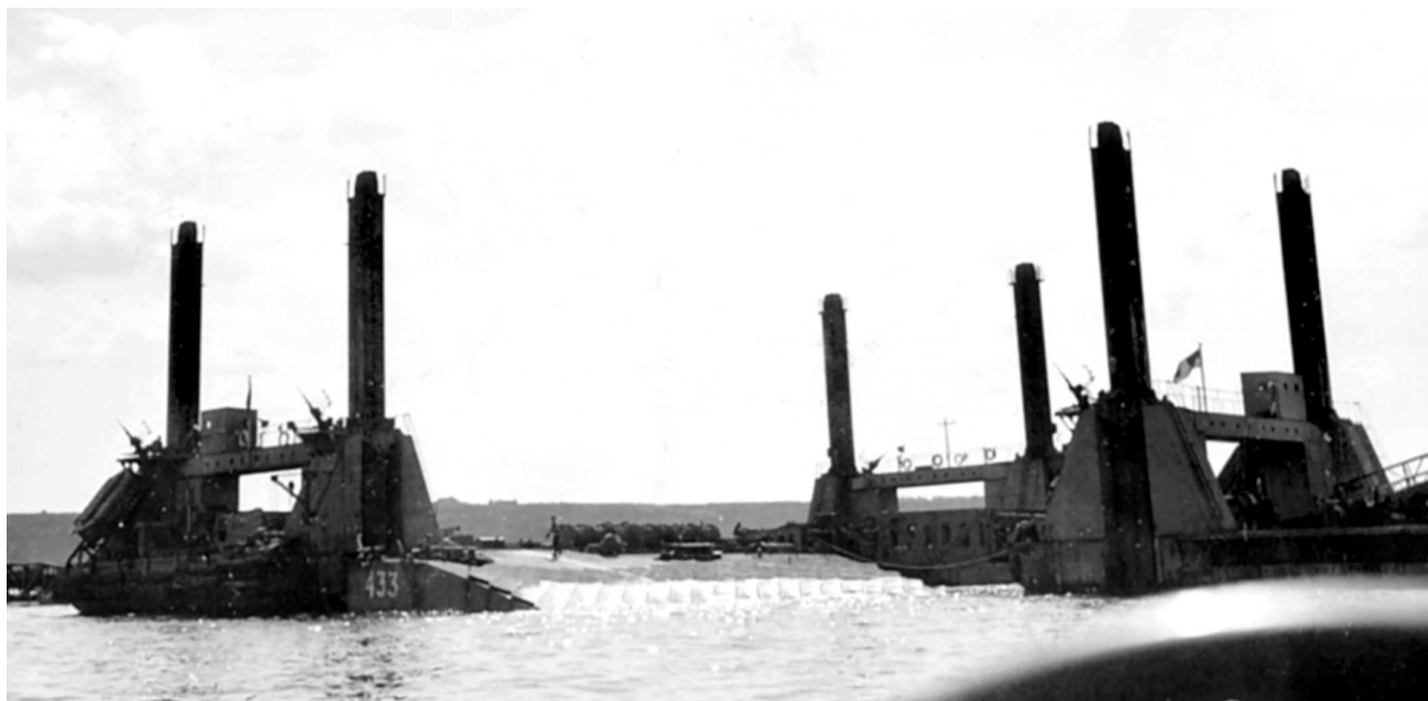
Высший секрет союзников – искусственная гавань «Малберри», позволившая выгрузить на побережье Нормандии военную технику, личный состав и грузы снабжения в рамках наращивания сил на береговом плацдарме.