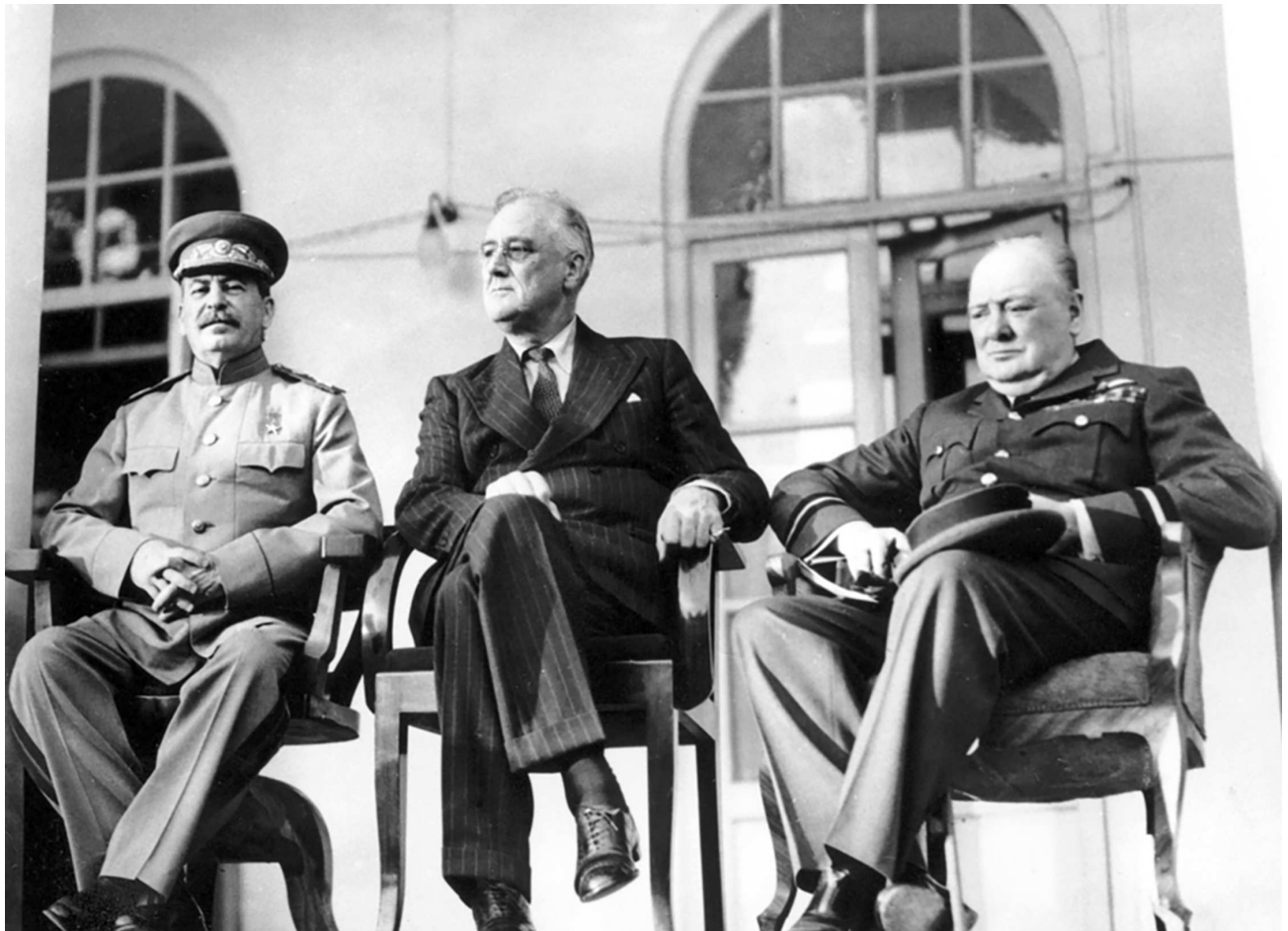
Конференция «Большой Тройки» в Тегеране в 1943 году стала переломным моментом в судьбе операции «Оверлорд».

командование, 9-е тактическое командование и 10-я группа аэрофоторазведки. Начав свои операции за несколько месяцев до намеченного дня «Д», тактические ВВС имели задачей последовательное уничтожение широкой дорожной инфраструктуры, чтобы максимально сократить (а в идеале – свести к нулю) переброску резервов и грузов в Нормандию. Отдельное внимание уделялось аэродромам, расположенным в радиусе 200 км от побережья и ключевым мостам через Сену и Луару, уничтожение которых позволило бы эффективно изолировать примыкающие к пляжам высадки районы от остальной части Франции. С началом вторжения спектр задач тактических ВВС предполагалось еще более рас-