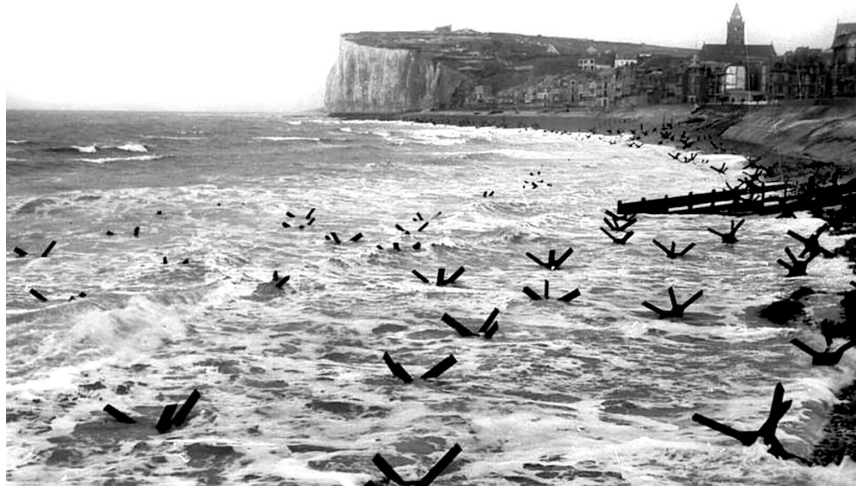
Береговая линия в районе Па-де-Кале.

но еще большая опасность грядет с Запада. Эта опасность – англо-американское морское вторжение. На Востоке потеря даже значительной части захваченного нами обширного пространства не нанесет смертельного удара по жизнеспособности Германии. Иное дело – Запад. Если противник сумеет прорвать нашу оборону на широком