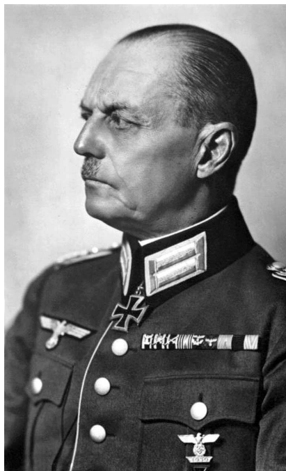
Главнокомандующий группы армий «Запад» генерал-фельдмаршал Герд фон Рундштедт.

фронте, то последствия этого – в самых ошеломляющих пропорциях – скажутся в самое ближайшее время. В связи с этим я больше не могу мириться с дальнейшим ослаблением Западного фронта в пользу других театров военных действий. Я решил усилить защиту на Западе, особенно в тех местах, откуда мы начнем свои дальнейшие операции против Англии 1 .