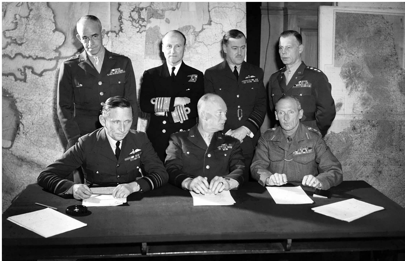
Старшие офицеры союзников, вовлеченные в операцию «Оверлорд». Слева направо верхний ряд: генерал-лейтенант Омар Брэдли (1-я американская армия), адмирал сэра Бертрам Рамсей (командующий военно-морских сил вторжения), старший маршал авиации сэо Трэфффорд Ли-Мэллори (командующий военно-воздушных сил вторжения), генерал-лейтенант Бедэл Смит (начальник штаба SHAEF). Слева направо нижний ряд: старший маршал авиации сэра Артур Тэддер (заместитель Верховного командующего экспедиционных сил), генерал Дуайт Эйзенхауэр (Верховный командующий), генерал-Бернард Лоу Монтгомери (командующий 21-й группы армий).

ные работы. Однако Сопротивление докладывало, что реальные результаты налетов не соответствуют ожиданиям. Железнодорожная сеть страны настолько густая, что позволяет достаточно легко развозить составы в объезд поврежденных участков и станций. За первые шесть недель бомбардировок общий объем железнодорожных перевозок сократился не более чем на 10%. Ситуация изменилась кардинально, когда к налетам на дороги и сортировочные станции были добавлены систематические атаки мостов и туннелей. К моменту вторжения 74 моста и туннеля, ведущих к побережью Нормандии, были уничтожены или выведены из строя. По меткому выражению Черчилля северо-западная Франция