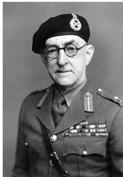
Командир отдельной 79-й бронетанковой дивизии генерал-майор Перси Хобарт, инициатор создания целого ряда специальных инженерных машин поддержки штурмовых сил вторжения.