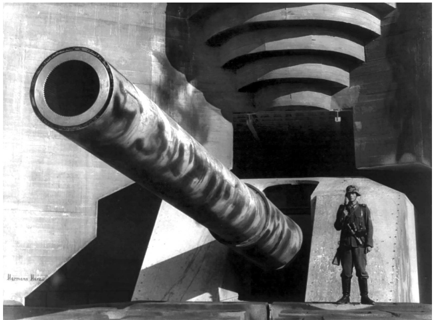
Один из пропагандистских снимков, призванных возвеличить мощь Атлантического вала.