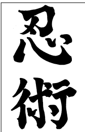
Иероглифическое написание слова ниндзюцу

Спрос на информацию о ниндзя был колоссальный. И мощная американская индустрия с готовностью откликнулась на него: на прилавках специализированных магазинов появились униформа и снаряжение ниндзя , самоучители «по боевой технике воинов-теней». Свою долю пирога поспешили урвать и последние «мастера ниндзюцу », которые,