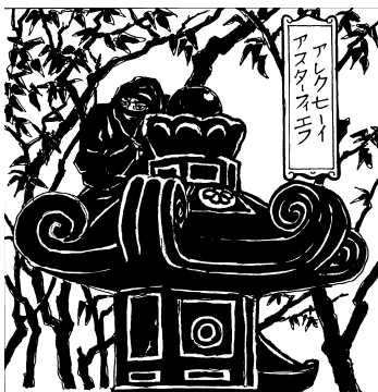
Ниндзя маскируется под каменный фонарь. Рисунок по мотивам японских гравюр

учными исследованиями. Именно поэтому мы не найдем в них ни ссылок на исторические источники, ни детального, основанного на фактах, анализа, ни цитат из «секретных» наставлений.