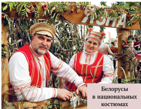
Белорусы в национальных костюмах

Если честно, многие из нас нервничают, когда россияне говорят Белоруссия: нам слышится в этом оттенок неуважения. Скорее всего, мы не правы: россияне, с которыми я об этом