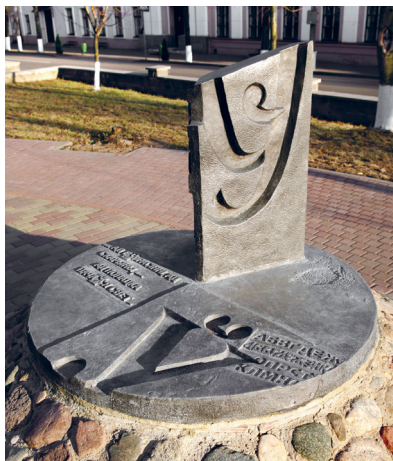
Памятник букве «Ў» в Полоцке. Скульптор И. Куржалов

Самое беларускамоўнае учреждение Беларусі — грамадзянскі транспарт: практычна ўсе аб'яўленьня на беларускам, названія астановак таксама. Калі будзеце ехаць у метро, названне «Плошча Леніна» поймеце без праблем, а вот насчет «Кастрычніцкай» не ўверана. Гэта «Кастрычніцкая». На схемах названія станцыяў напісаны на беларускам і рускай.