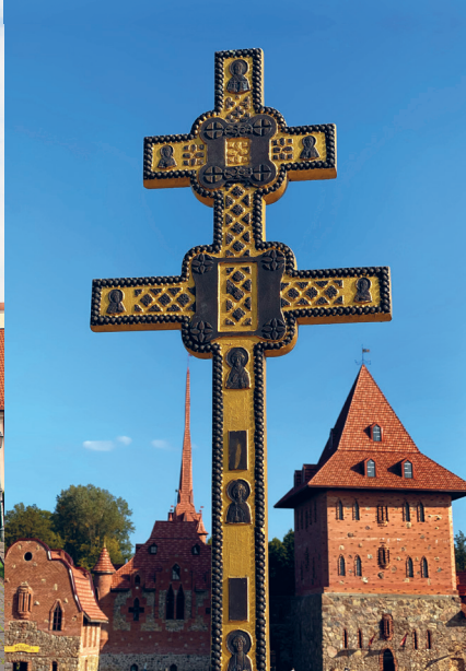
Сула, Исторический парк. Увеличенная копия креста Евфросинии Полоцкой

национальный герой Чили, уроженец имения Медвядка в Кореличском районе. Классик польской оперы Станислав Монюшко родился в имении Убель Червенского района. В деревне Старые Василишки родился и до 19 лет прожил великий (некоторые говорят: величайший) польский рок-музыкант Чеслав Немен .