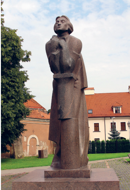
Памятник Адаму Мицкевичу в Вильнюсе. Авторы Г. Йокубонис, В. Чеканаускас