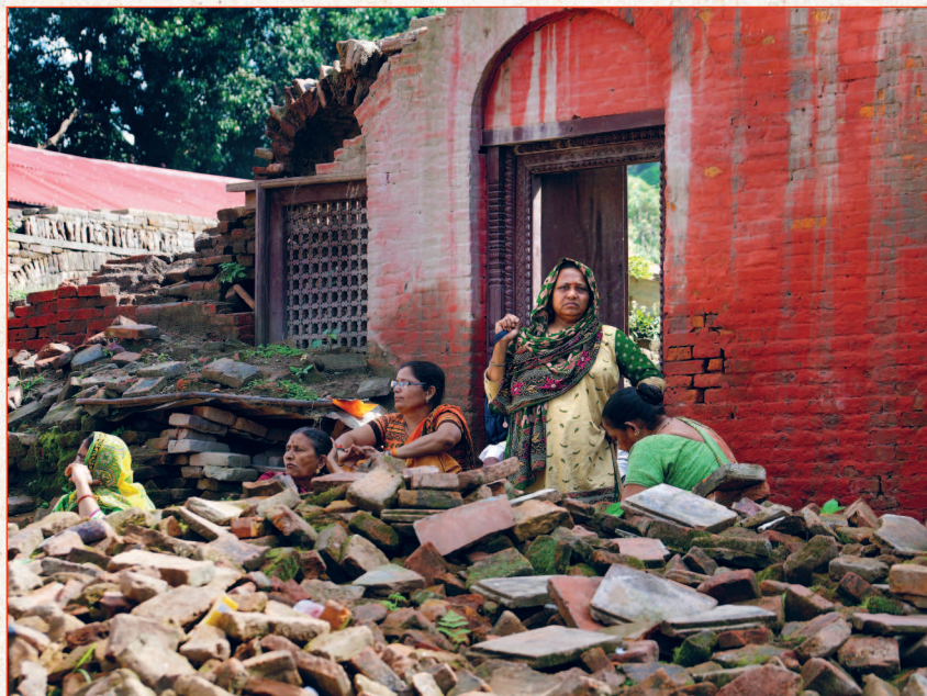
Пашупатинатх после землетрясения

Восьмибальное землетрясение 1934 года унесло жизни свыше 10 тысяч людей. В катастрофе 1988 года погибло более тысячи.