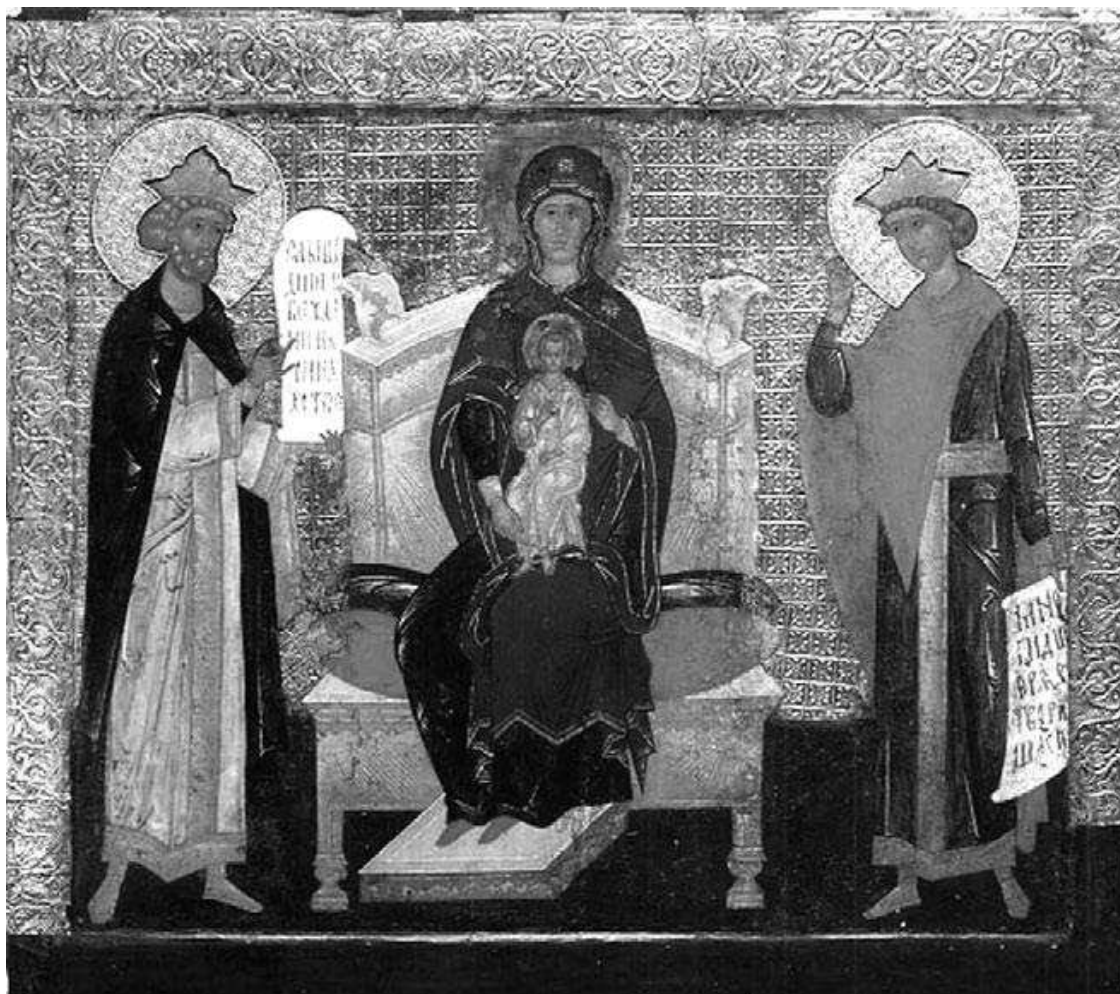
Святой царь и пророк Давид Псалмопевец