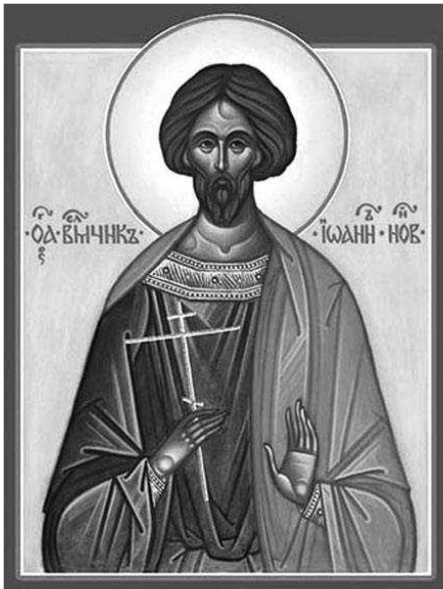
Святой великомученик Иоанн Новый Сочавский

Иоанн Сочавский в своей земной жизни был купцом, и благодаря твердой вере в Бога дела его шли весьма успешно.