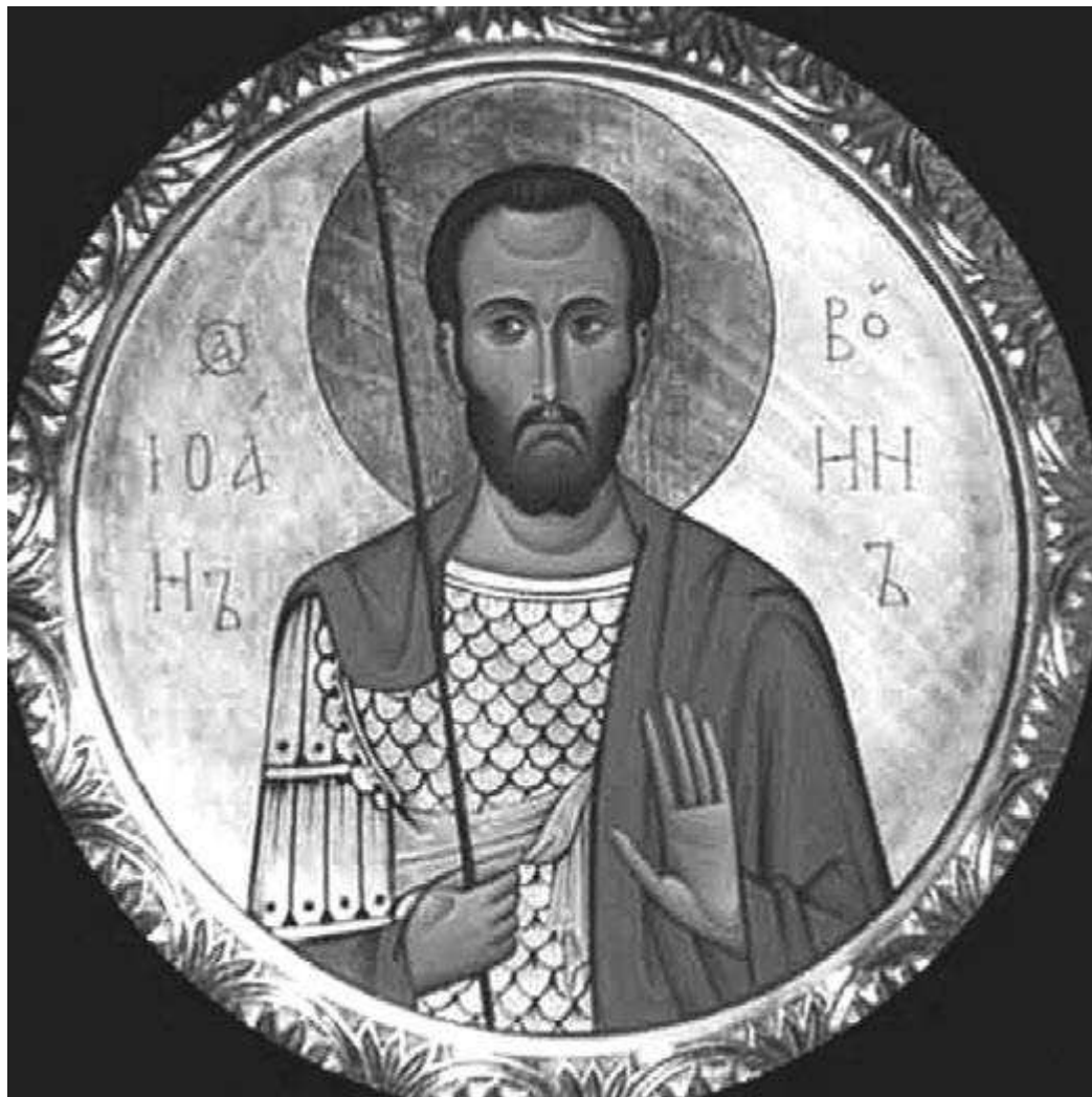
Святой мученик Иоанн Воин

Эту молитву рекомендуется читать тем, кому угрожают конкуренты или предстоит судебное разбирательство. Но молиться можно лишь в том случае, если правота на вашей стороне.