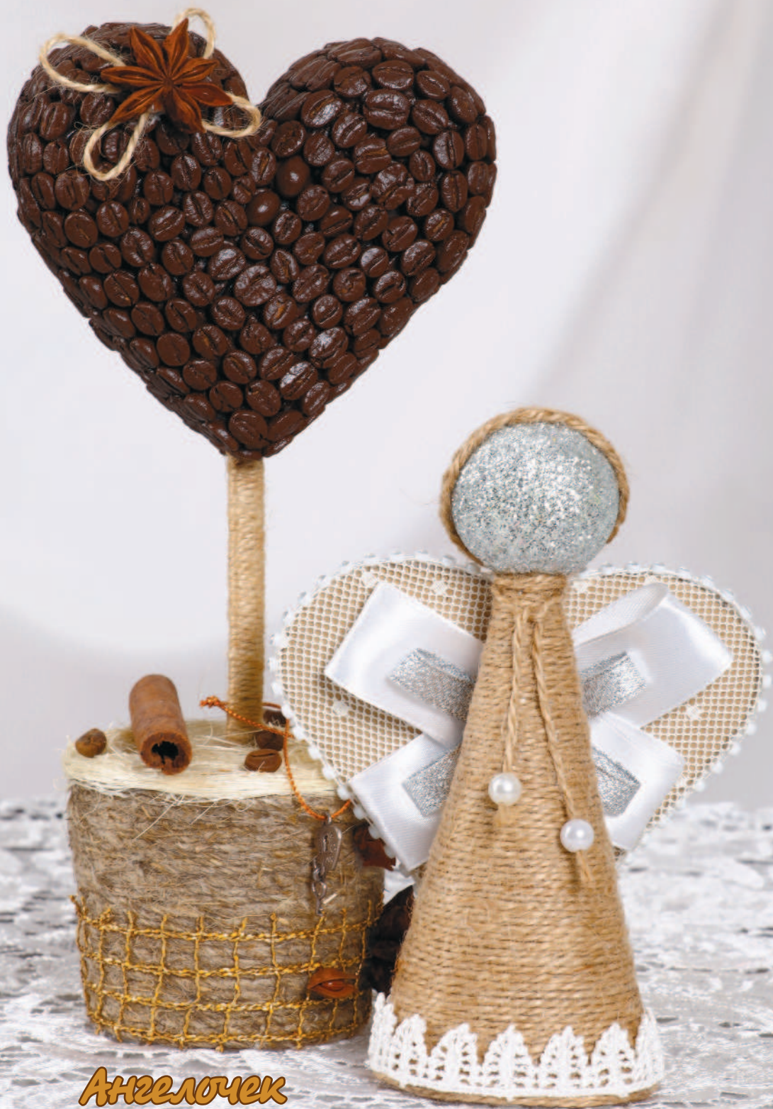
Ангелочек «С любовью в сердце»