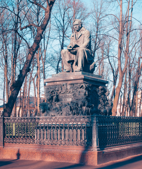
Памятник Ивану Андреевичу Крылову

«Царь-плотник», находящийся на Адмиралтейской набережной сейчас, — это копия памятника из города Зандам, где сохранился подлинник.