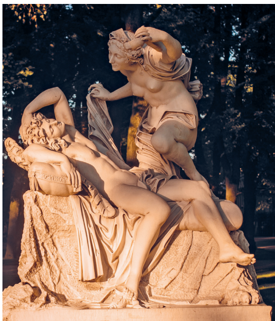
Амур и Психея