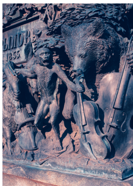
Звери в основании памятника

Когда смотришь на бронзовый зверинец, устроившийся в ногах у писателя, поражаешься их реалистичности. Удивительно, но скульптор принял сложное решение создавать всех героев басен Крылова с натуры, и на эту работу у него ушло почти пять лет. Многие животные жили прямо в доме скульптора. Так, например, за ручным волком, лисой, медведем и ослом ухаживали дети