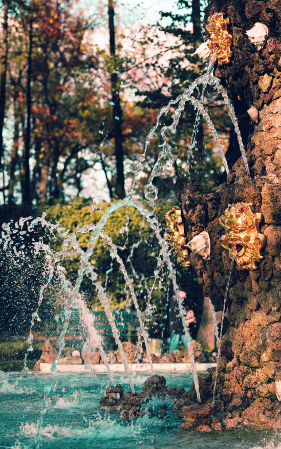
Фонтан «Коронный» в Летнем саду

почвами. Деревья высаживались круглый год. Работа кипела сутки напролет. В создании облика Летнего сада принимали участие лучшие зодчие не только России, но и Европы, такие как Жан-Батист Леблон, Михаил Земцов, Карл Росси, Бартоломео Растрелли. По замыслу Петра, парк должен был стать местом притяжения для всех знатных жителей новой столицы. Здесь устраивались роскошные балы и гуляния для дворянских семей. При Петре попасть в сад можно было только по приглашению, а его потомки постепенно превратили парк в достояние общественности, и сад стал доступен любому желающему. Теперь предлагаю неспешно рассмотреть постройки и детали Летнего сада.