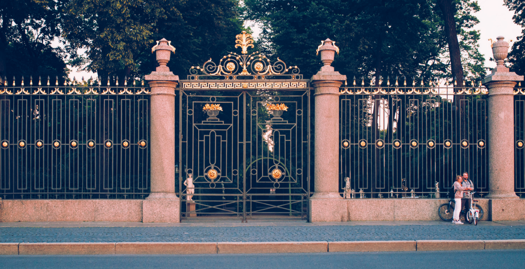
Вход в Летний сад