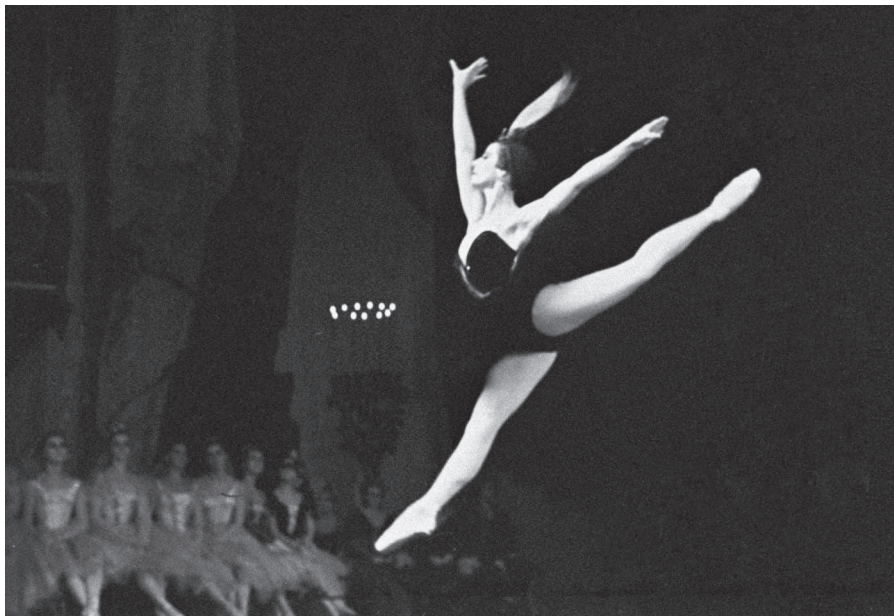
«Лебединое озеро». Одиллия. 1969 год.

Милашкина была женой Атлантова, и, зная об этом, наблюдать сцену удушения Дездемоны было особенно интересно.