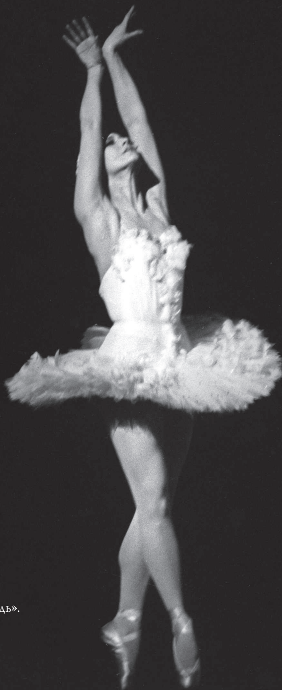
«Умиравший лебедь». 1968 год.