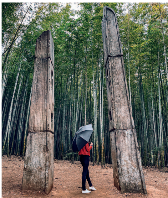
Ворота в «параллельный» мир из дорамы «Король: вечный монарх». Бамбуковый лес Ахопсан