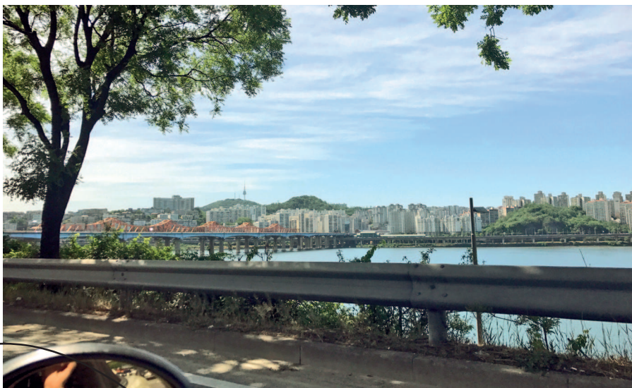
Сеульская башня и один из мостов через реку Ханган