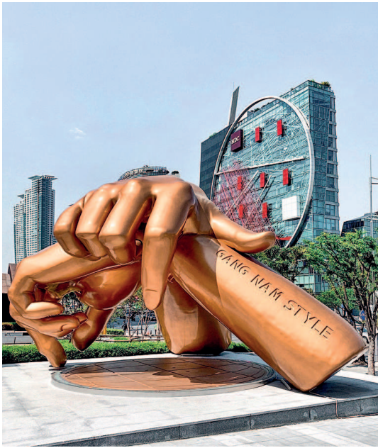
Памятник танцу «Gangnam Style» в Сеуле