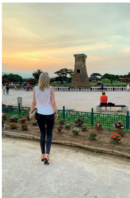
Обсерватория Чхонсондэ в городе Кёнчжу