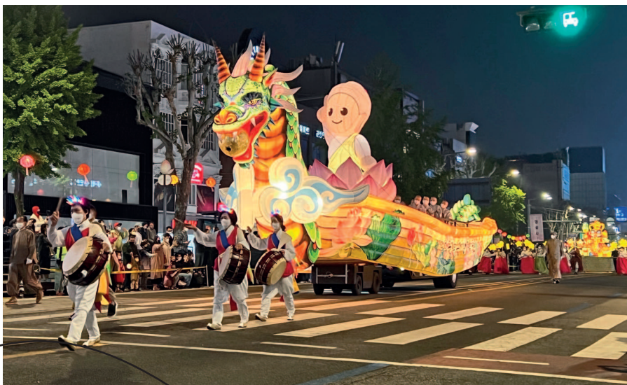
Парад в честь дня рождения Будды