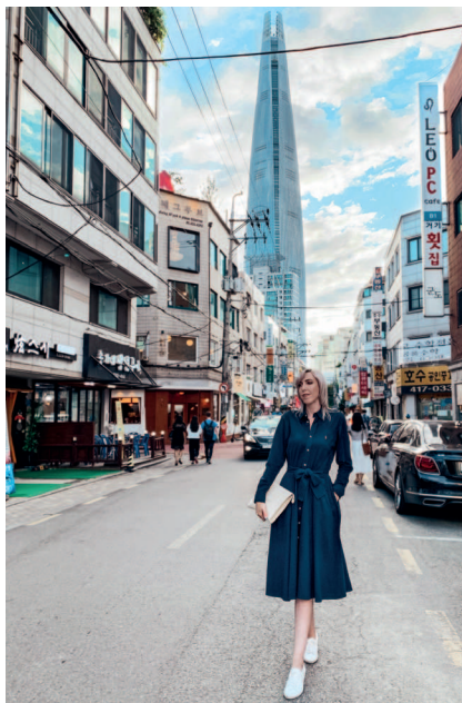
Малозэтажные домики-виллы и самый высокий небоскреб Кореи – Лотте Тауэр