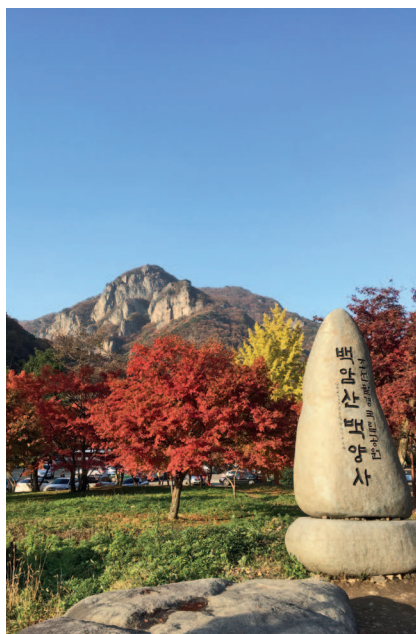
Осень в национальном парке Нэджангсан