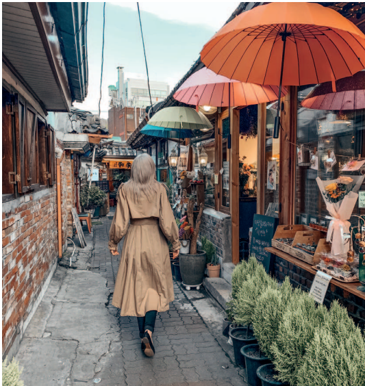
Традиционные домики-ханоки в районе Иксондон