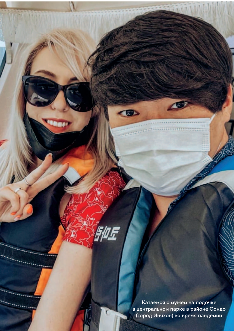
Катаемся с мужем на лодочке в центральном парке в районе Сондо (город Инчхон) во время пандемии