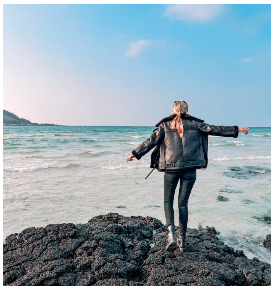
Пляж Хёпче на острове Чеджу