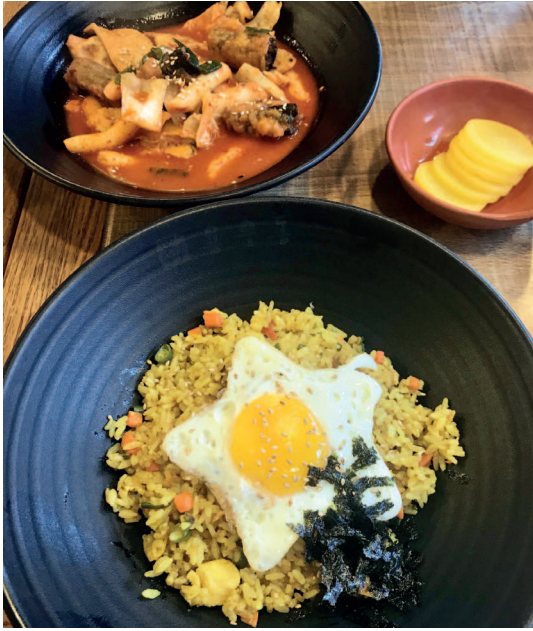
Корейская кухня. Вверху: Токпокки, одэн, киммари. Внизу: обжаренный рис с курицей и карри