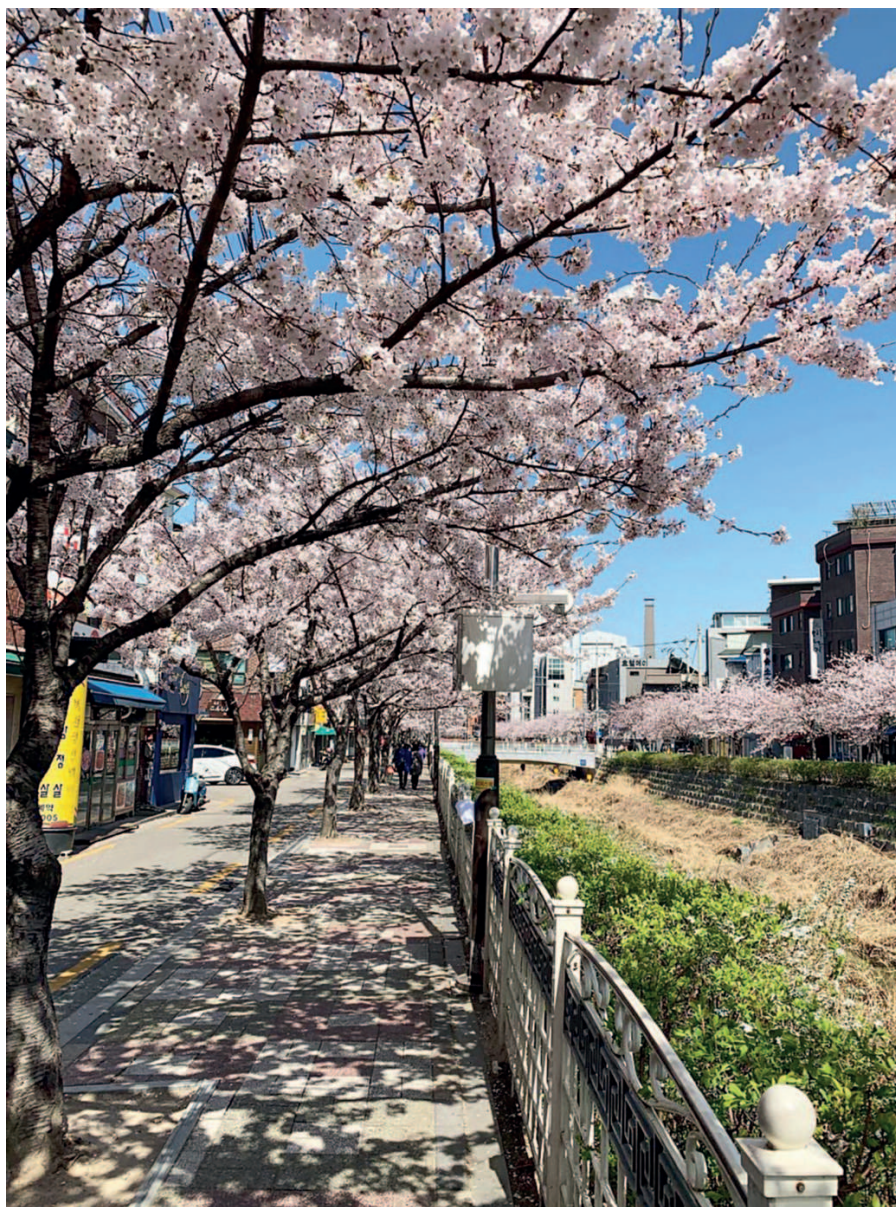
Цветение сакуры в Сеуле в районе станции метро Hansung University