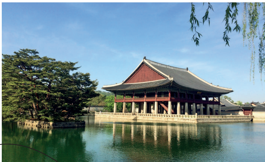
Дворец Кёнбоккун, королевский банкетный зал Кёнхвару летом