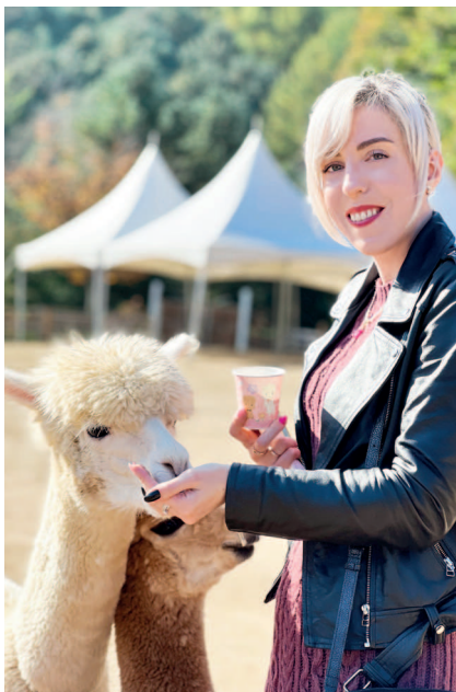
Кормлю альпак в Alpaca World