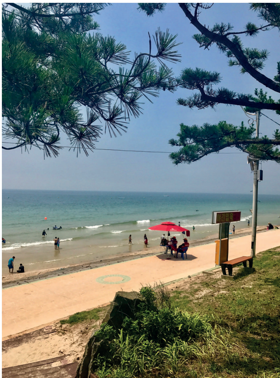
Один из пляжей на Желтом море