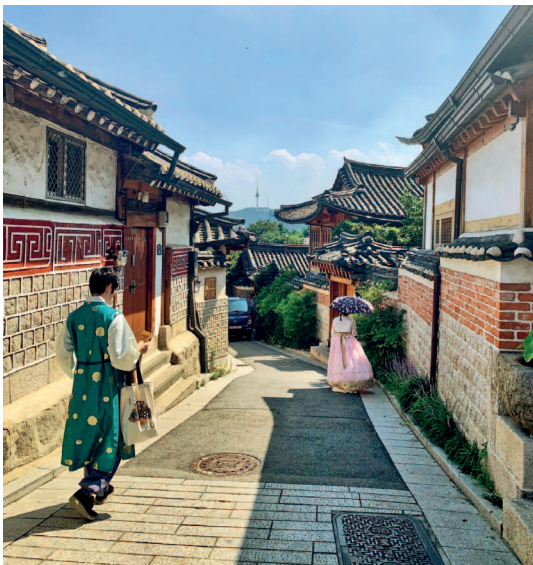
Фольклорная деревня Букчон в Сеуле