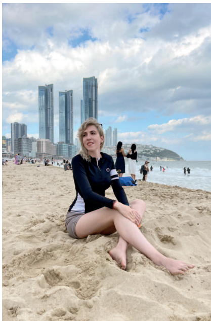
Пусан, пляж Хэундэ. На мне кофта от корейского купального костюма.