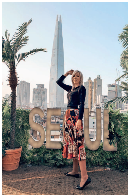
Кафе «Seoulism» с красивым видом на Лотте Тауэр