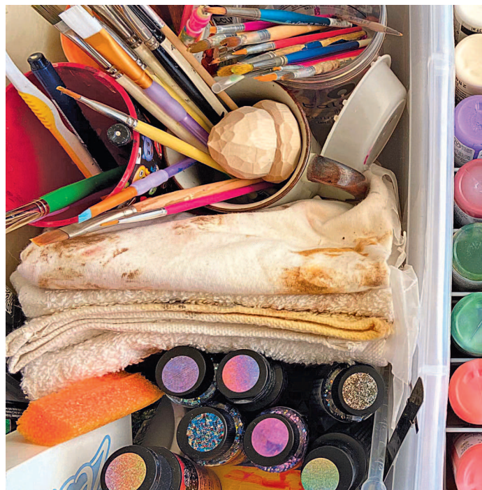
Я использую акриловые краски из местного магазина для рукоделия.

Я предпочитаю акриловые краски и не использую акварель или масло. Я люблю процесс росписи не меньше, чем саму резьбу, и с удовольствием экспериментирую с акриловыми красками, чтобы получить различные эффекты — далее