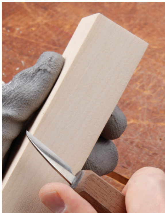
Липа: мягкая и легкая, с плотной текстурой.

Липа — моя любимая древесина для резьбы по дереву, так как она мягкая и легкая, с плотной, однородной и умеренной волокнистостью. Некоторые