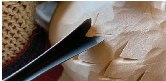
Угловая стамеска или стамеска-уголок