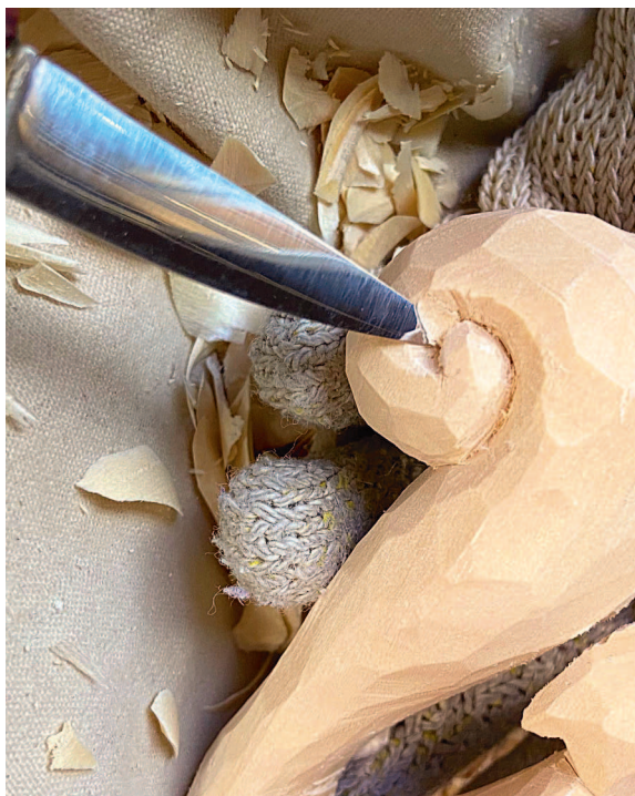
Классический резчицкий нож с лезвием длиной 2,5–3,8 см хорошо подойдет для проектов, описанных в этой книге.

и размеров, а также из разных материалов. Но здесь наиболее важно то, как инструмент ложится в руку и как ощущается в ней. Нож в буквальном смысле является продолжением вашей руки, и, если его неудобно держать и у вас нет полного контроля над ним, вы создаете себе неудобство еще до того, как начнете резьбу.