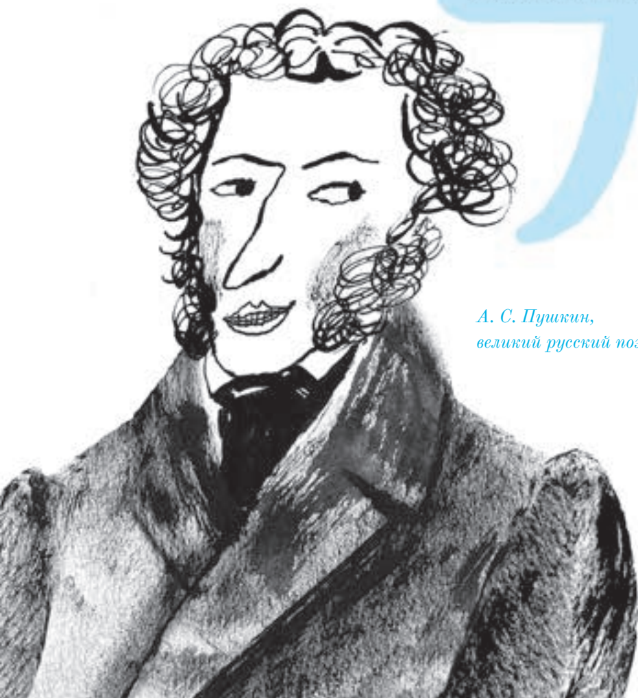
А. С. Пушкин, великий русский поэт

ЧТО КАСАЕТСЯ ДО МОИХ ЗАНЯТИЙ, Я ТЕПЕРЬ ПИШУ НЕ РОМАН, А РОМАН В СТИХАХ, — ДЬЯВОЛЬСКАЯ РАЗНИЦА.