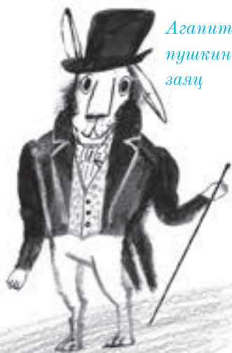
Агапит, пушкинский заяц