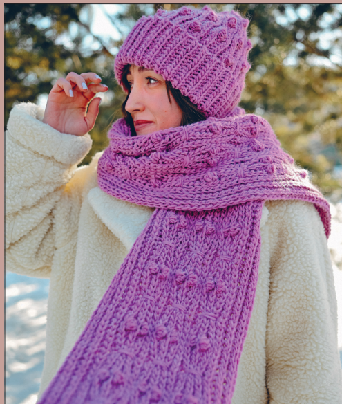
ШАРФ И ШАПКА 235