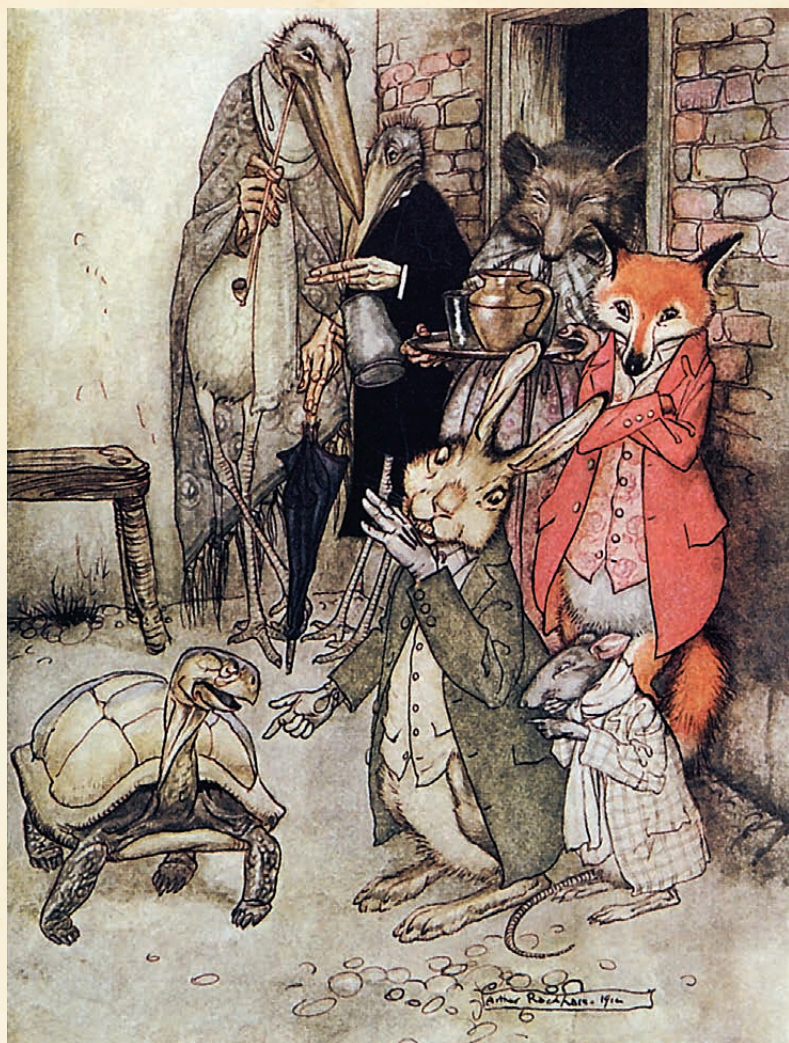
ЧЕРЕПАХА И ЗАЯЦ