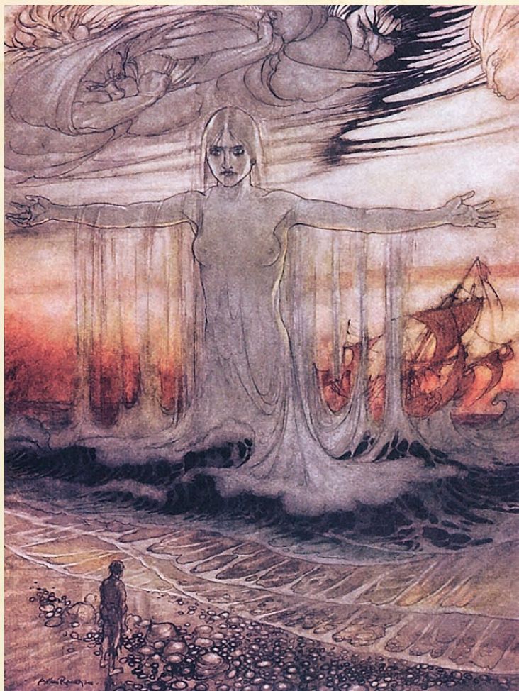
ЧЕЛОВЕК, ПОТЕРПЕВШИЙ КРУШЕНИЕ, И МОРЕ