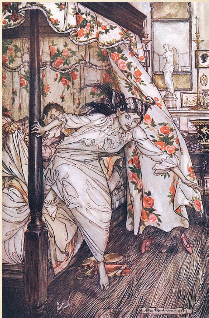
ЛАСКА И АФРОДИТА