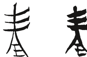
Китайские буквы (или пиктограммы), нарисованные двумя стилями мазков.

В комиксе привнесение своего стиля, индивидуальная манера использования контура, нажима, закраски может подчеркнуть красоту изображаемого объекта и смысл высказывания.