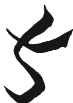
Рис. 5. Китайская пиктограмма.

В комиксе привнесение своего стиля, индивидуальная манера использования контура, нажима, закраски может подчеркнуть красоту изображаемого объекта и смысл высказывания.