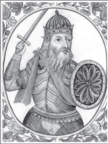
Великий князь Святослав Игоревич. Миниатюра из «Царского Титулярника». 1672 г.