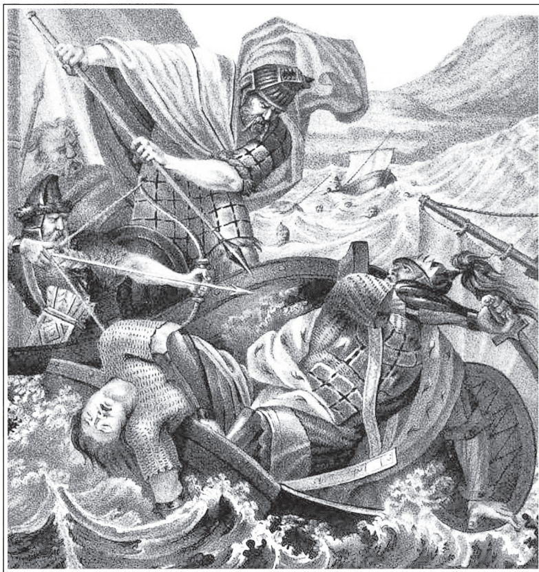
Б. А. Чориков. Гибель Святослава

Владимир (ок. 956—1015) через год после бегства к варягам вернулся с ними, занял Новгород, объявил войну киевскому князю Ярополку (? — 978 или 980) и сватался к Рогнеде , доче-