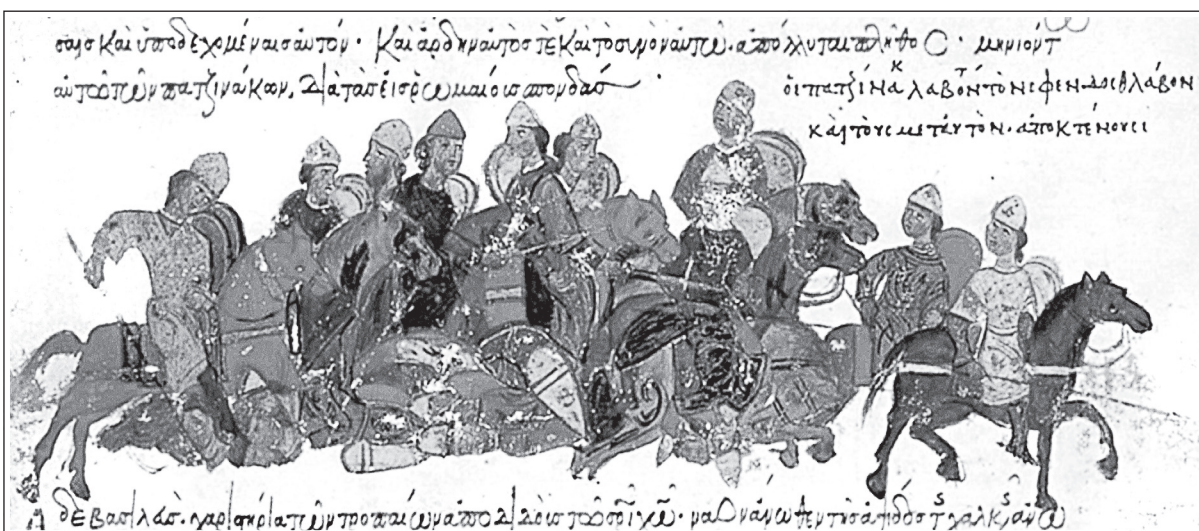
Преследование отступающей русской армии византийцами. Миниатюра из мадридского списка «Истории» Иоанна Скилицы. XIII в.

Русские отряды во главе с князем Святославом Игоревичем (между 920 и 942 — 972) впервые вторгаются в Волжскую Булгарию и разоряют ее