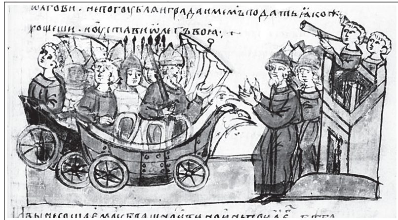
Олег ставит корабли на колеса. Миниатюра из Радзивилловской летописи. XV в.

Радимичи, союз восточнославянских племен междуречья верхнего Днепра и Десны, входят в состав Древнерусского государства. •