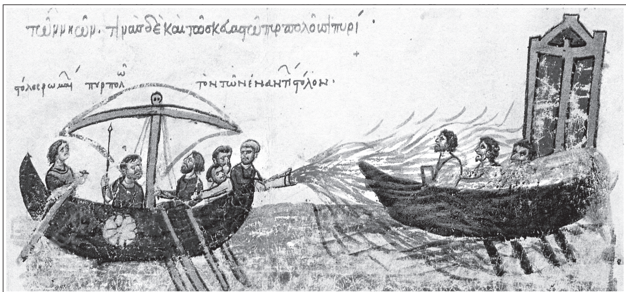
Использование «греческого огня». Миниатюра мадридского списка Хроники Иоанна Скилицы. XII в.

Киевский князь Олег (?—912) на 200 кораблях отправляется в поход на Византию. Его войско состоит из варягов, иль-