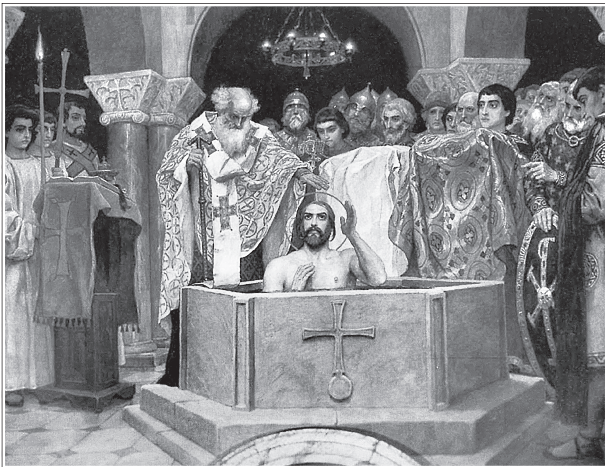
В. М. Васнецова. Крещение Владимира

Своим детям князь распределил уделы так: старший, Святополк (кровный отпрыск Ярополка ), получил в княжестве Туров (дреговичи); Полоцк получили дети покойного Изяслава ; Ярослав правил в Новгороде; Всеволод — во Владимире-Волынском; Святослав был поставлен над древлянами; Мстислав — в Тмутаракани; Станислав — в Смоленске; Судислав — во Пскове; Борис — в Ростове; Глеб — в Муроме. •