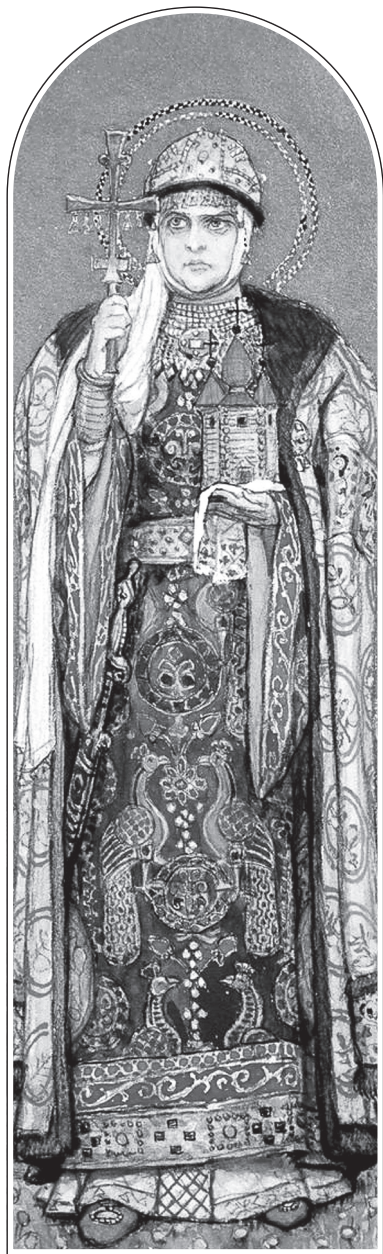
В. М. Васнецов. Княгиня Ольга. 1885—1893 гг.

Киевский князь (с 912) Игорь (ок. 878—945) при содействии варягов и печенегов совершает второй поход на Византию. Греческие послы встречают его на берегу Дуная и предлагают