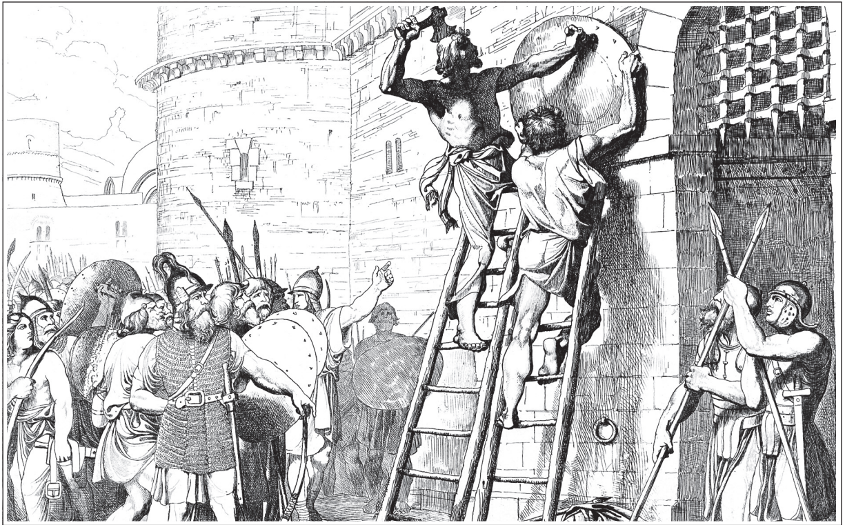
Ф. А. Бруни. Олег прибавляет щит свой к вратам Царьграда. Гравюра 1839 г.

В современных исторических публикациях это событие оспаривается и даже снабжается ироничным примечанием: то, чего не было и быть не могло. Но привлекательные легенды оказываются живучее мнений историков.