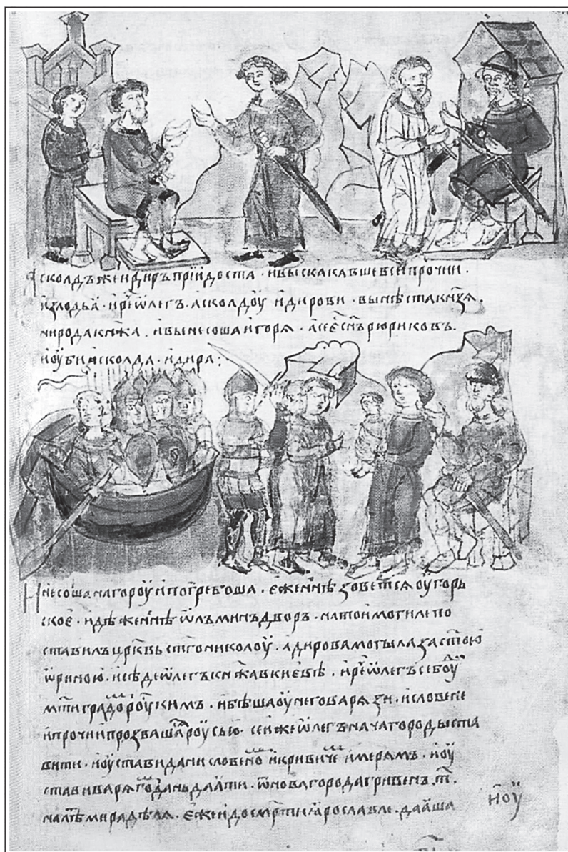
Олег показывает маленького Игоря Аскольду и Диру. Миниатюра из Радзивилловской летописи. XV в.

Северяне, союз восточнославянских племен в VIII—X вв. в бассейне рек Десна, Сейм и Сула, входят в состав Киевского государства. Названия «севера», «Северские города»,