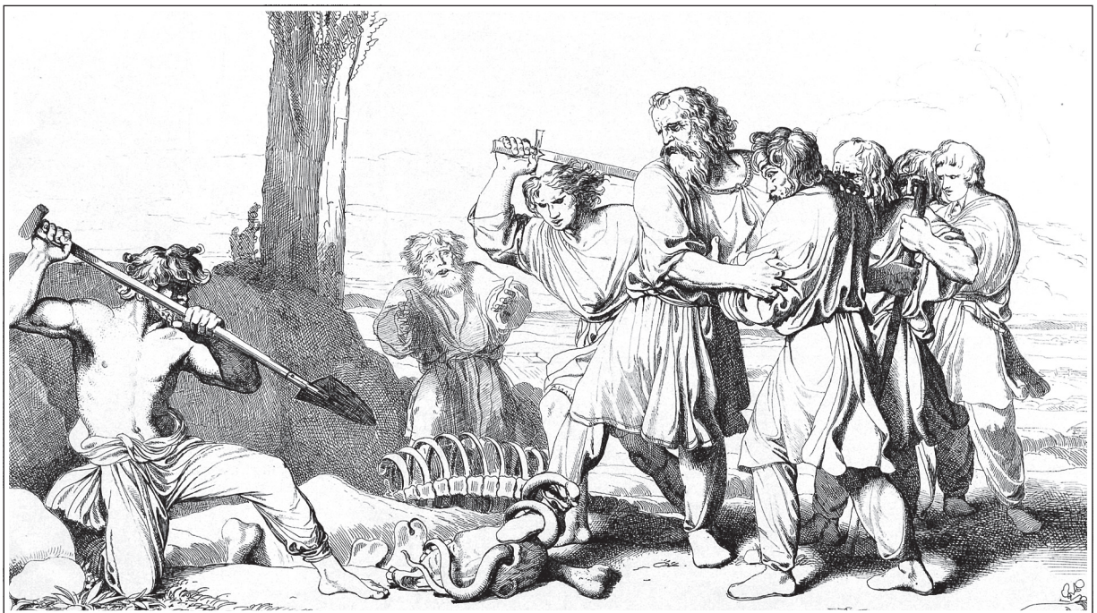
Ф. А. Бруни. «Так вот где таилась погибель моя!». Смерть Олега. Гравюра 1839 г.

В современных исторических публикациях это событие оспаривается и даже снабжается ироничным примечанием: то, чего не было и быть не могло. Но привлекательные легенды оказываются живучее мнений историков.