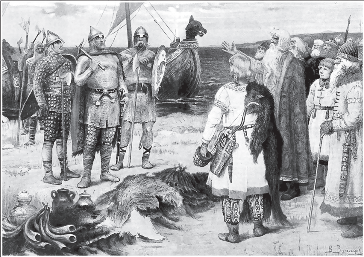
В. М. Васнецов. Прибытие Рюрика в Ладогу

По названию племени государство именуется Русью. ●