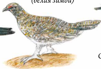
Белая куропатка (белая зимой)