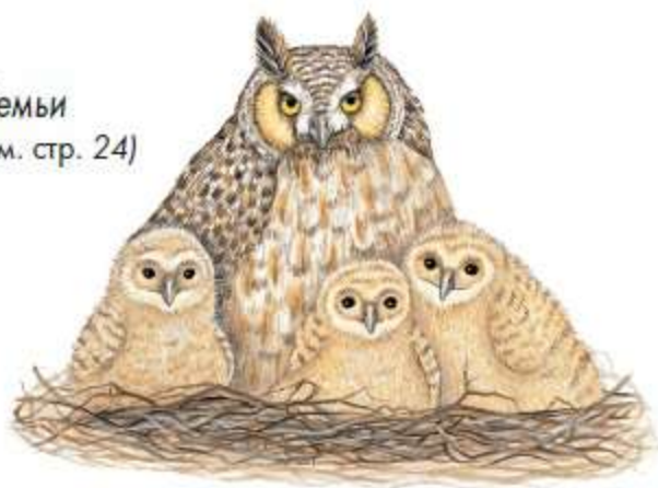
Семьи (см. стр. 24)