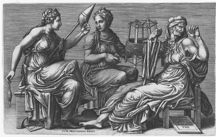
Парки. Гравюра XVI в.

Если представить основные идеи стоиков без привязки к определенному мыслителю, можно выделить следующие характерные черты этой философской системы: