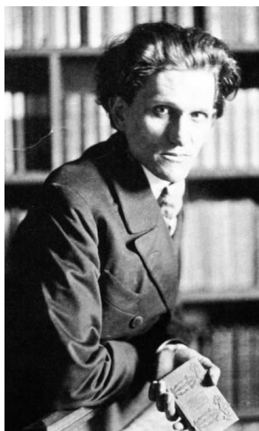
Стефан Георге в молодости

воплотил в 15-летнем юнце по имени Кронфельд, не что другое, как Яхве!»