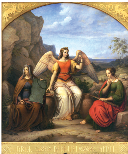
Й. Лунд. Норны. 1844 г.