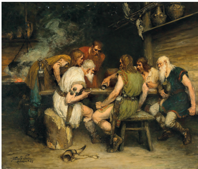
Ф. Леке. Воины. Игра в кости. 1919 г.