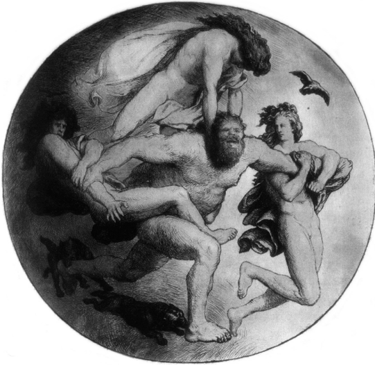
Л. Фрёлих. Один и его братья убивают Имира. 2-я пол. XIX в.

ла. Спасся лишь великан по имени Бергельмир, чье имя означает «ревуший подобно медведю», который и дал начало новому поколению йотунов.