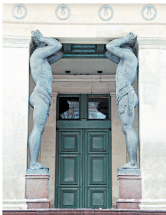
Атланты парадного подъезда Нового Эрмитажа

художественных коллекций. Это первое в России здание художественного музея специальной постройки, поэтому для создания проекта обратились к «иностранный звезде» — немецкому архитектору Л. фон Кленце, получившему мировую известность после создания в Мюнхене Глиптотеки и Пинакотеки. Он разработал проект здания в неогреческом стиле, типичном в те годы для оформления общественных зданий. Непосредственно руководили строительством В.П. Стасов и Н.Е. Ефимов. Самая известная деталь — монументальное крыльцо, украшенное портиком, который поддерживают фигуры атлантов, высеченных из сердобольского гранита скульптором А.И. Теребневым. Это те самые атланты, которые в песне «держат небо на каменных руках».