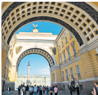
Арка Главного штаба

Свернем налево по Большой Морской улице. Среди застройки этого участка Большой Морской особый интерес представляет здание еще одного банка — Азовско-Донского ( Большая Морская ул., 3–5 ). Оно было построено по проекту Ф.И. Лидвала и оказало огромное влияние на архитектуру Серебряного века, ознаменовав начало перехода от модерна к неоклассике. Композиция здания асимметрична, однако это связано с тем, что его строили в две очереди — сперва была построена левая часть здания (1907–1909), а уже после завершения строительства банк купил соседний участок, на котором была построена правая часть здания (1912–1913).