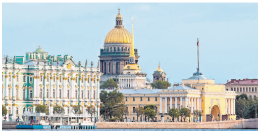
Зимний дворец и Адмиралтейство

Пройдя под арками, мы выходим на Дворцовую площадь — главную площадь города. Одна из главных особенностей этой площади — ее удивительный ансамбль зданий, строившихся в самых разных стилях на протяжении почти ста лет, однако воспринимающихся как единое целое. Прямо напротив нас стоит самое старое строение — Зимний дворец ( Дворцовая пл., 2 ). Огромный дворец строился для императрицы Елизаветы Петровны ее любимым архитектором Ф.Б. Растрелли в стиле барокко. Однако строительство затянулось на целых восемь лет (1754–1762), и к моменту его завершения к власти пришла Екатерина II. Она барокко не любила, предпочитая входивший в моду классицизм, но благоразумно решила построенный дворец не перестраивать, ограничившись только оформлением интерьеров и пристройкой новых корпусов.