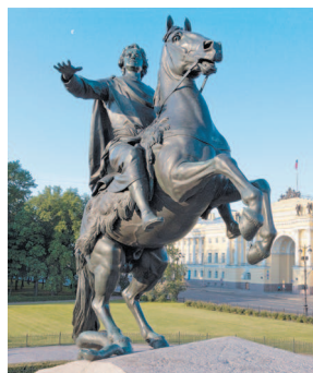
Медный Всадник – памятник Петру I на Сенатской площади. Автор: Этьен Морис Фальконе

Свернем теперь на площадь Труда и пересечем Галерную улицу. Мы окажемся рядом с Николаевским дворцом , построенным в 1853–1861 годах