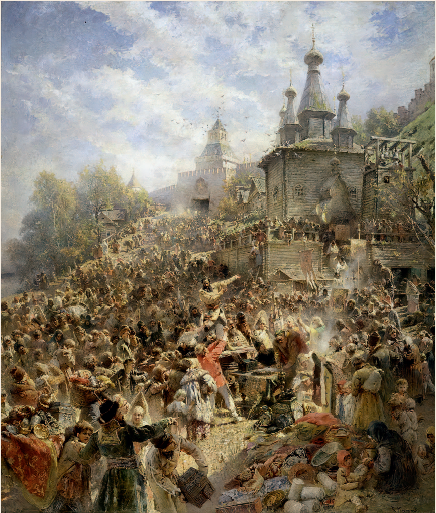
Константин Маковский. Минин на площади Нижнего Новгорода, возле церкви Иоанна Предтечи, призывающий народ к жертвованиям. 1896

идет против них, и стали разбегаться. Большая половина их ушла в низовья Волги. Остальные под предводительством князя Трубецкого начали переговоры с Пожарским. Во время этих переговоров к Москве подошли поляки и всеми силами напали на Пожарского.