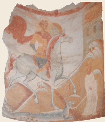
Святой Георгий Победоносец. Фреска. XII век. Старая Ладога

Федор Кошка служил великому князю московскому Дмитрию Донскому, который, выступая в 1380 году в знаменитый победоносный поход против татар на Куликово поле, оставил Кошку править вместо себя Москвой — «Блюсти град Москву и охранять великую княгиню и все семейство его».