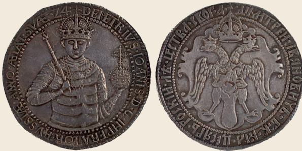
Медаль Лжедмитрия I с легендой на русском и латинском языках. 1605

3 мая 1606 года в Москву в сопровождении многочисленной свиты с необыкновенной пышностью въехала Марина Мнишек и остановилась у инокини Марфы, «матери» Дмитрия, в Вознесенском монастыре. 8 мая состоялось бракосочетание Марины и Лжедмитрия I. На свадьбу приехало много иностранцев, которых, за неимением гостиниц, разместили по частным домам. Вели они себя по отношению к москвичам плохо, москвичей же в день свадьбы даже не пустили во дворец. Это настроило москвичей против самозванца.