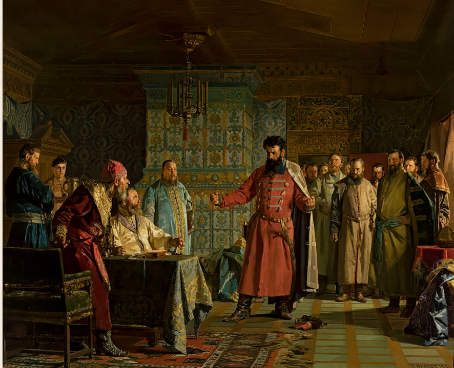
Николай Неврев. Захарий Ляпунов и Василий Шуйский. 1886

Бояре, задумав посадить на русский престол польского королевича Владислава, впустили в Кремль польские войска во главе с гетманом Гонсевским, который стал самовластно распоряжаться в стране. А на севере к оккупации перешли шведы. Россия оказалась перед прямой угрозой утраты независимости.