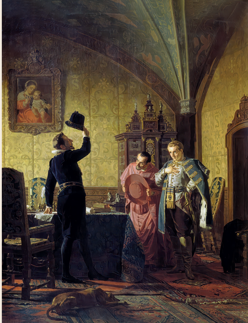
Николай Неврев. Присяга Лжедмитрия I польскому королю Сигизмунду III на введение в России католицизма. 1874

За свое недолгое царствование Лжедмитрий I успел построить в Московском Кремле новый дворец.