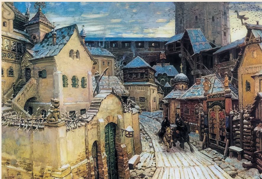
Аполлинарий Васнецов. Гонимы. Ранним утром в Кремле. 1913

После смерти царя Ивана Грозного на престоле воцарился его старший сын Федор. По свидетельствам людей того времени, новый царь не в состоянии был справиться с государственными делами. Со смертью же Федора прекратилась династия князей Рюриковичей, правившая Русью 700 лет.