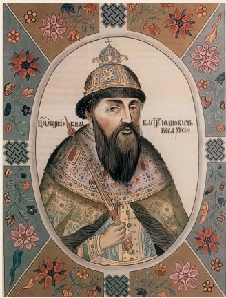
Василий Иванович Шуйский. Царский титулярник. 1672

Боярский заговор против воцарившегося Лжедмитрия I возглавил Василий Шуйский. Удобным поводом для свержения самозванца стала его свадьба с Мариной Мнишек. Заговорщики воспользовались раздражением москвичей против поляков, приехавших в Москву с Мариной и якобы позволявших себе бесчинства. В ночь с 16 на 17 мая 1606 года они ударили в набат и объявили сбежавшемуся народу, что ляхи бьют царя. Направив толпы на поляков, заговорщики прорвались в Кремль.