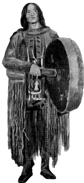
Тунгусский шаман. Открытка, начало XX века

вошло именно эвенкийское слово «шаман»: оно, а также слово «шаманить» встречаются в самых ранних письменных источниках, в которых говорится о населении Сибири. Это делопроизводственные документы, разные отчеты и записки. Протопоп Аввакум в своем «Житии» (1672–1673) пишет: «Шаманить — сиречь гадать» — и уподобляет шамана волхву (волшебнику, колдуну). Европейские путешественники тоже восприняли этот термин, и в конце XVII века мы встречаем в их трудах слова Schaman, Schamannen. В XIX столетии этот термин прочно входит в научную литературу. О становлении и развитии этого научного концепта можно прочесть в работах М. В. Хаккарайнен 2 .