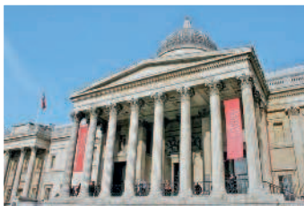
Национальная галерея содержит более 2000 образцов западноевропейской живописи XIII — начала XX века

Вечер. Оставьте достаточно времени, чтобы добраться до театра. Будьте внимательны: в антрактах не заказывайте напитки «под обрез», незадолго до того, как снова поднимется занавес! Если вы собираетесь поесть после спектакля, то заранее отыщите ресторан и закажите там столлик до начала представления.